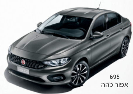
695 אפור כהה