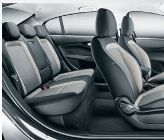
בד שחור בז' 156