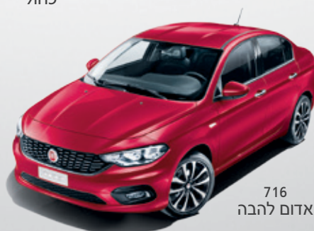
716 אדום להבה