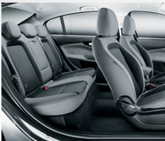
בד שחור כסוף 152