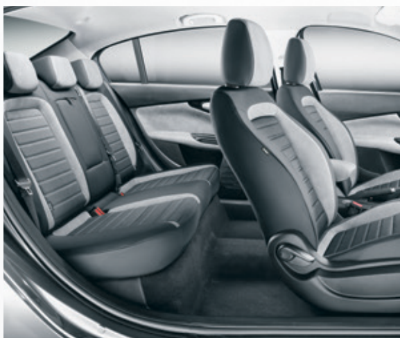
בד יקרתי אפור 111