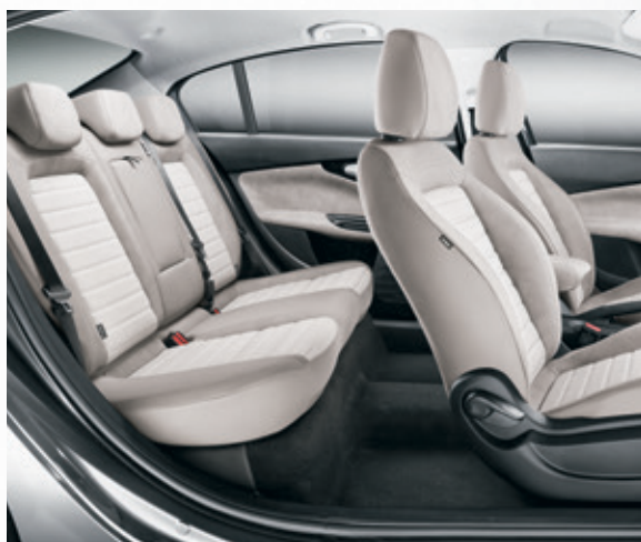
בד יקרתי בז' 165