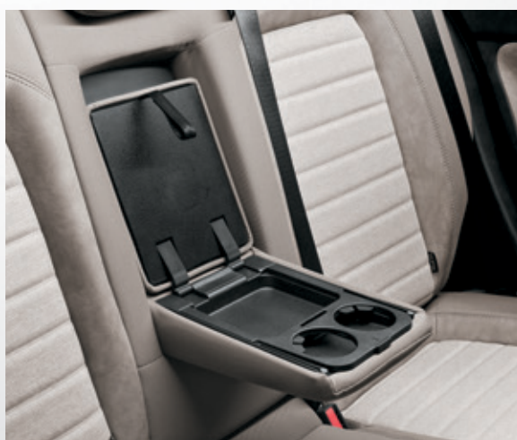
משענת יד אחורית + תא אחסון ומתקני כוסות (בדגם LOUNGE)