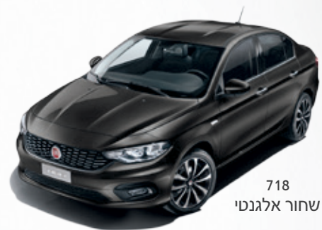
718 שחור אלגנטי