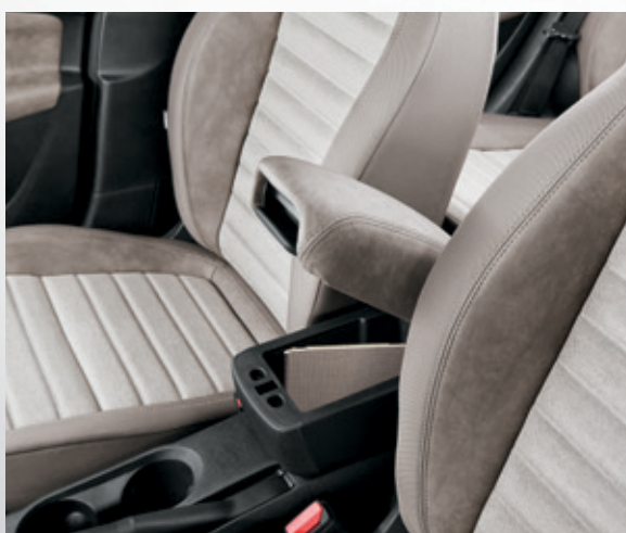
משענת יד קדמית + תא אחסון