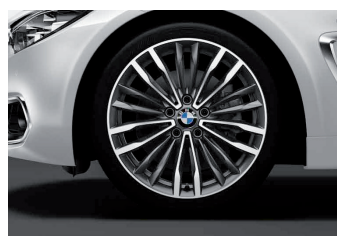
חישוקי סגסוגת קלה 19" דגם Multi-Spoke style 708