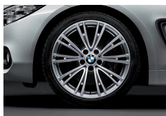
חישוקי סגסוגת קלה 19" דגם V-Spoke style 626 Individual