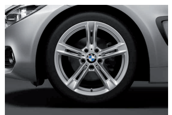
חישוקי סגסוגת קלה 18" דגם Star-Spoke 707