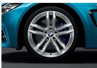
חישוקי סגסוגת קלה 19" דגם Double-Spoke style 704M