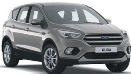
כסף שמפניה (O08)