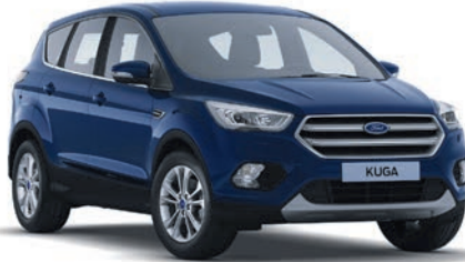
כחול בלייזר (OF9)