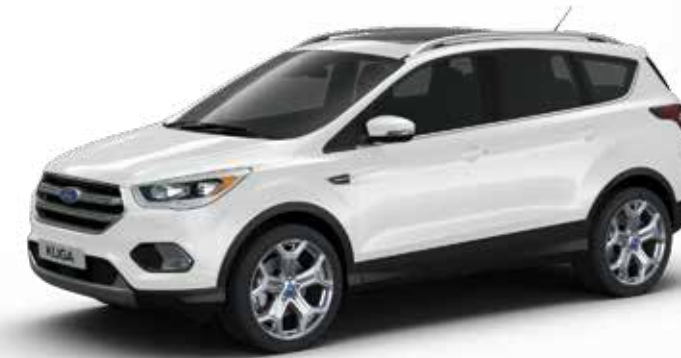
לבן פלטינה * (0FA)