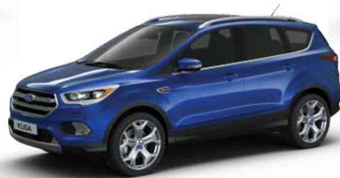
כחול מטאלי (0FG)