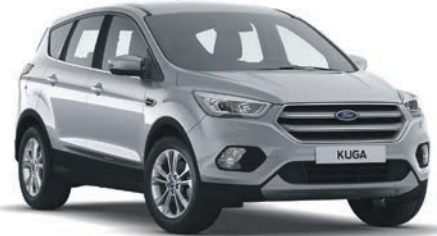
כסף מטאלי (OF0)