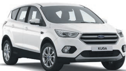
לבן קפוא (OF5)