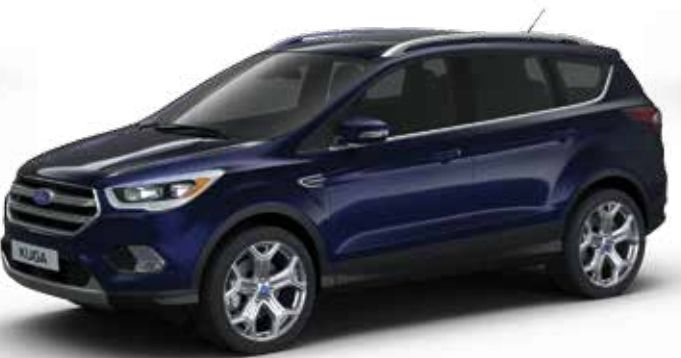
כחול בלייר (0FR)