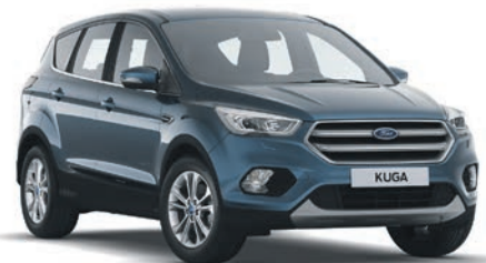
כחול כרום מטאלי (O06)