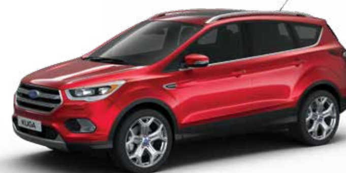
אדום לוחט מטאלי * (0FK)