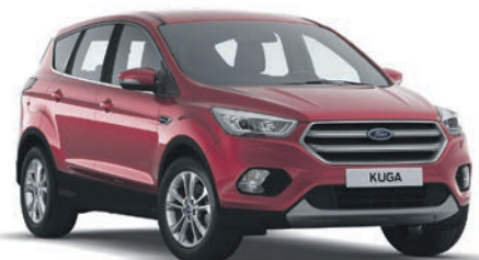
אדום לוהט מטאלי * (OFK)