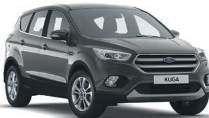
אפור מגנטי (OFU)