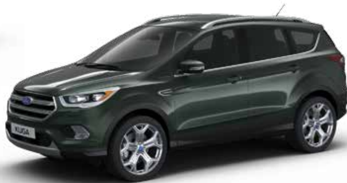
ירוק יער (0F1)