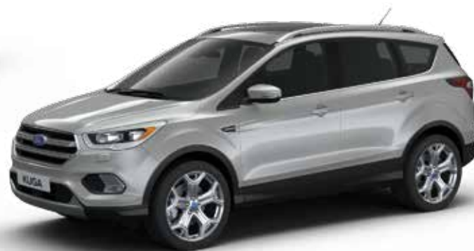
כסף מטאלי (0FO)