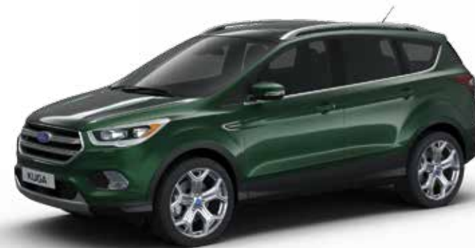
ירוק אינסטינקט (0FQ)