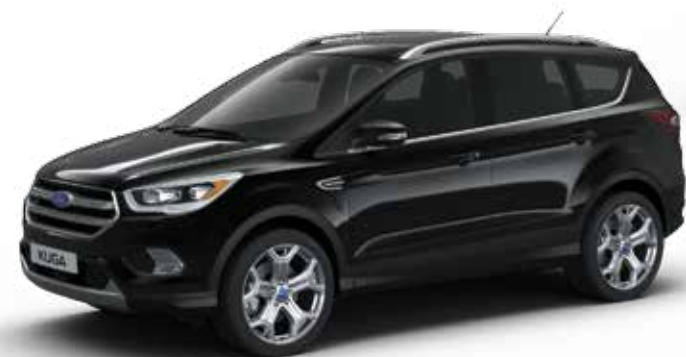
שחור אבסולוטי (0FP)