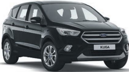
שחור אבסולוטי (OF8)