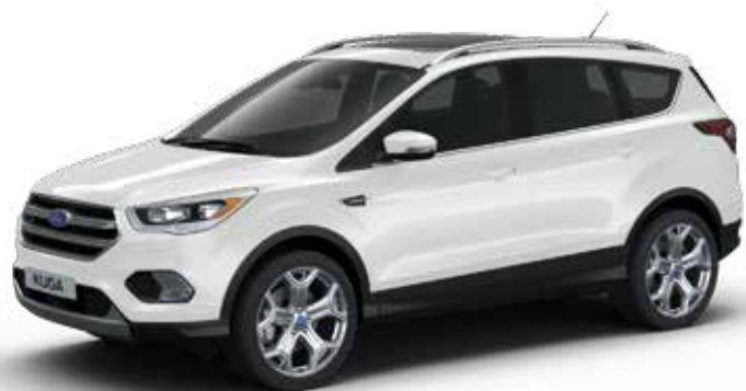
לבן קפוא (0F5)