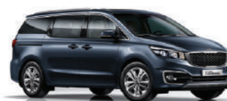
Formal Deep Blue