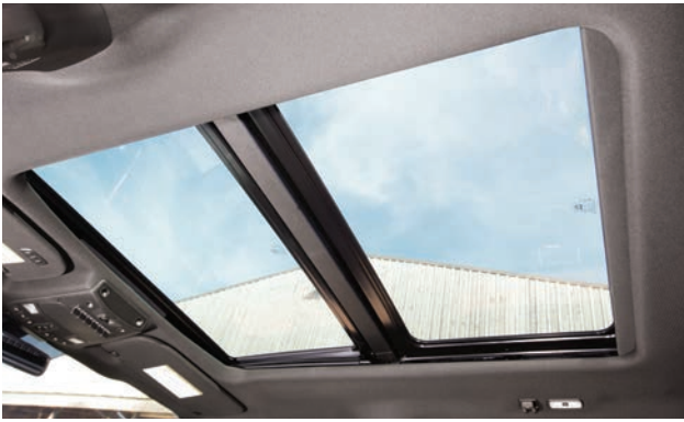
חלון שמש פנורמי Sunroof