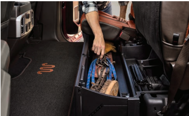
תא אחסון מתקפל נסתר מתחת למושב האחורי