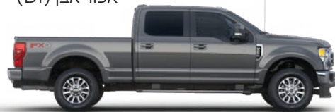
אפור מגנטי (J7)