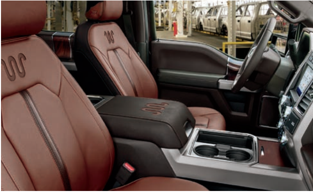
חלל פנימי עשיר ואלגנטי