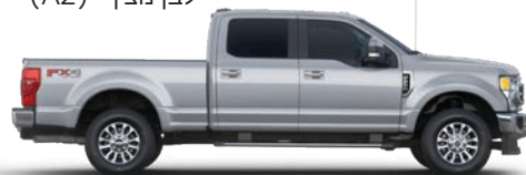
כסף אייקוני (J5)