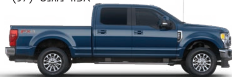
כחול ג'ינס (N1)