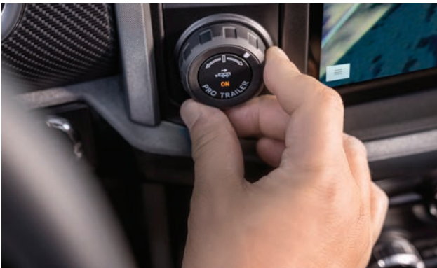
– Ford Pro Backup Assist מערכת עזר לנסיעה לאחור עם נגרר