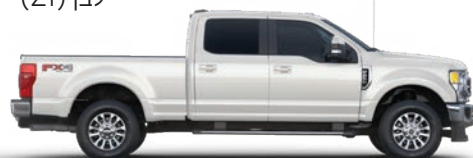
לבן נוצץ* (A2)