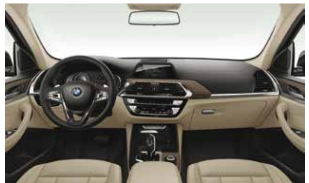
חבילת עיצוב Luxury Line ריפוד עור Vernasca במבחר צבעים לבחירה, גימור פנים עץ 'Fineline Cove' עם פס קישוט מבליט כרום, חיפוי Sensatec לחלקם העליון של הקונסולה המרכזית, לוח השעונים ודיפוני הדלתות.