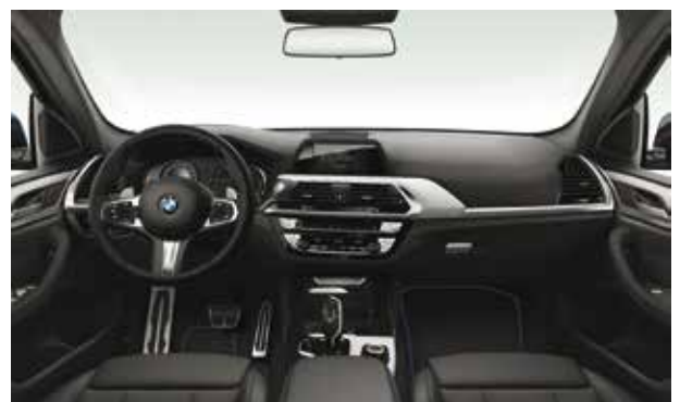
חבילת עיצוב M-Sport מושבי ספורט בריפוד בד משולב עור שחור עם תפרים כחולים, גלגל הגה M-sport, גימור פנים אלומיניום Rhombicle עם פס קישוט מבליט כרום, דוושות M ייחודיות וחיפוי תקרה בגוון אפור Anthracite.