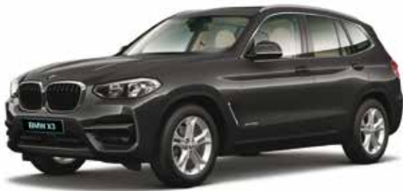
חישוקי סגסוגת "18 מדגם Double-spoke style 688, מסילות גג ומסגרת חלונות צד בגימור אלומיניום