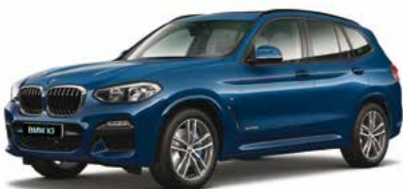
חבילת עיצוב M-Sport חישוקי סגסוגת "19 מדגם Double-spoke style 698 M, מסילות גג ומסגרת חלונות צד בגימור שחור מבריק (Individual Shadow line), פגושים וחצאיות צד M-aerodynamic.