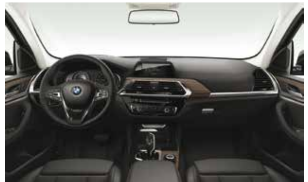
חבילת עיצוב xLine מושבי ספורט, ריפוד בד משולב עור בגוונים אפור Anthracite ושחור, גימור פנים עץ 'Fineline Cove' עם פס קישוט מבליט כרום.