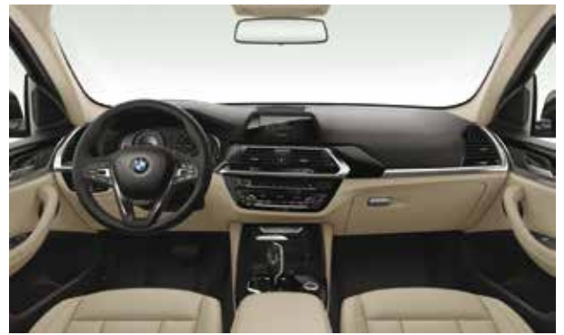
ריפוד Sensatec בגוון Canberra beige, גימור פנים שחור מבריק עם פס קישוט מבליט כרום