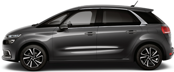
אפור פלטיניום מטאלי