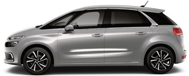
אפור פלדה מטאלי