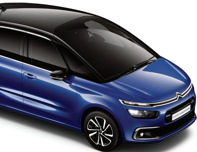
*למכשירים תומכים בלבד **ראו הערה בסוף הקטלוג