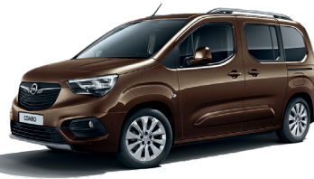
Cosmic Brown (GLV)