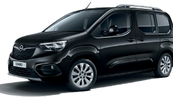
Onyx black (G7R)