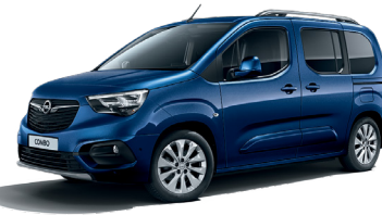
Night Blue (GBT)