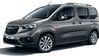
Moonstone Grey (G40)