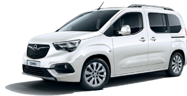
White Jade (G20)