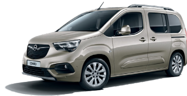
Cool Grey (GAC)