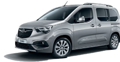
Quartz Grey (G4I)