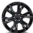
RQM 21" (RS)*