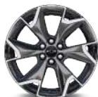
SP4 20" (RS)