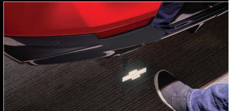
תיחה חשמלית, חישן רגל מוקרן על הרצפה