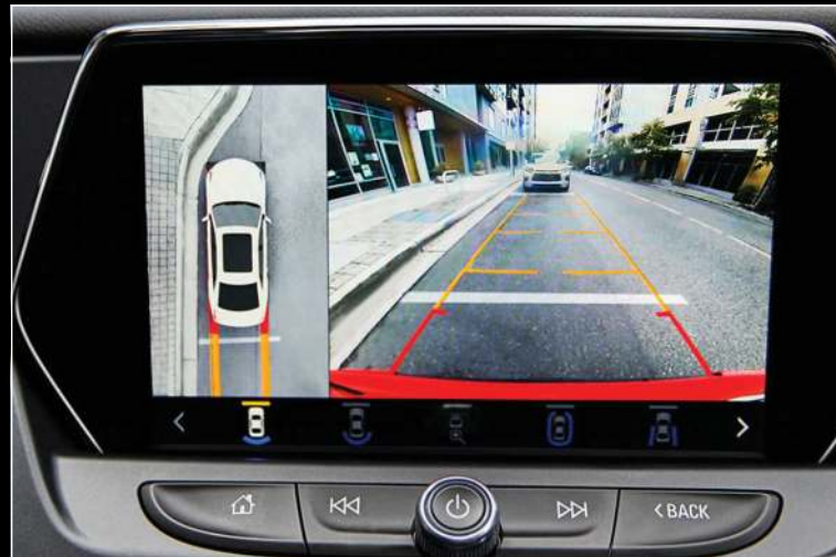
מצלמת חניה HD 360, עם עיבוד תמונה דיגיטלי ומערך הדמיות מתקדם