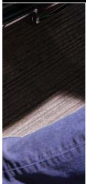
תא מטען בפתיחה