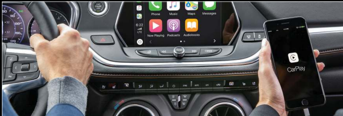
מערכת מוליטימדיה מתקדמת, עם אפשרות לחיבור BT של שני מכשירים במקביל