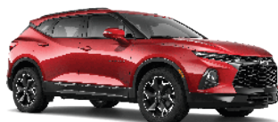
אדום קייבן מטאלי *(GPJ)