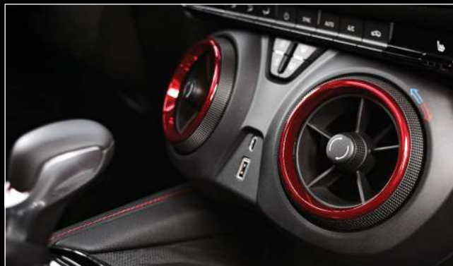
פנתי מיזוג עם הדגשה אדומה (RS) וחיבור USB Type-C