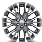
SP5 20" (PREMIER)