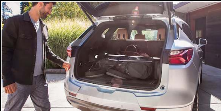
מערכת ארגון בתא המטען למניעת סלטול חפצים