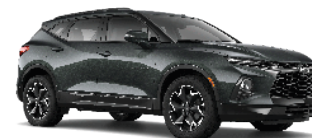
אפור כהה מטאלי (G7Q)