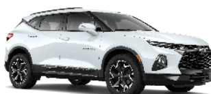
לבן פסגה (GAZ)