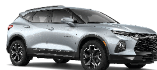
כסף מטאלי (GAN)