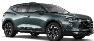
אפור גרפיט מטאלי (GPA)