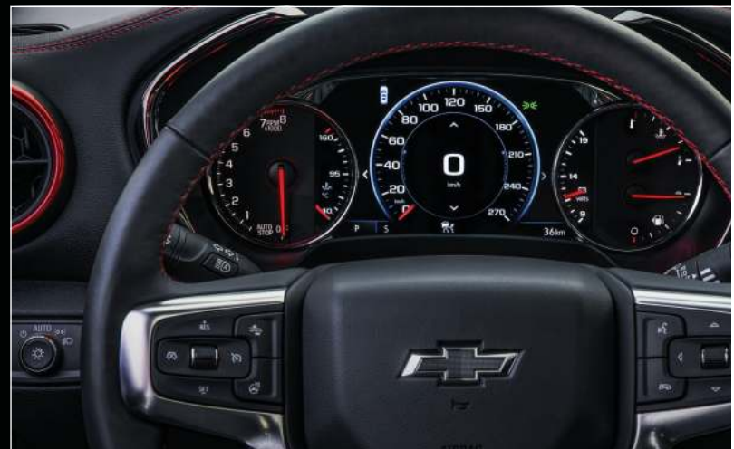
לי 8" עם תצוגה משתנה