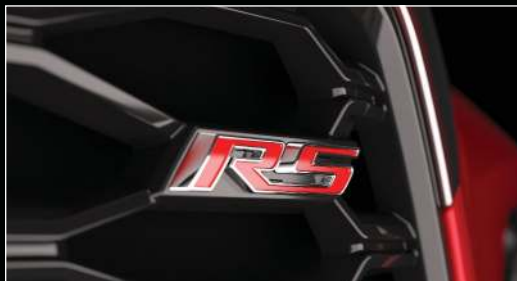
סמל RS בשכבה הקדמית (RS)