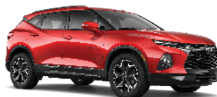
אדום לוהט (G7C)