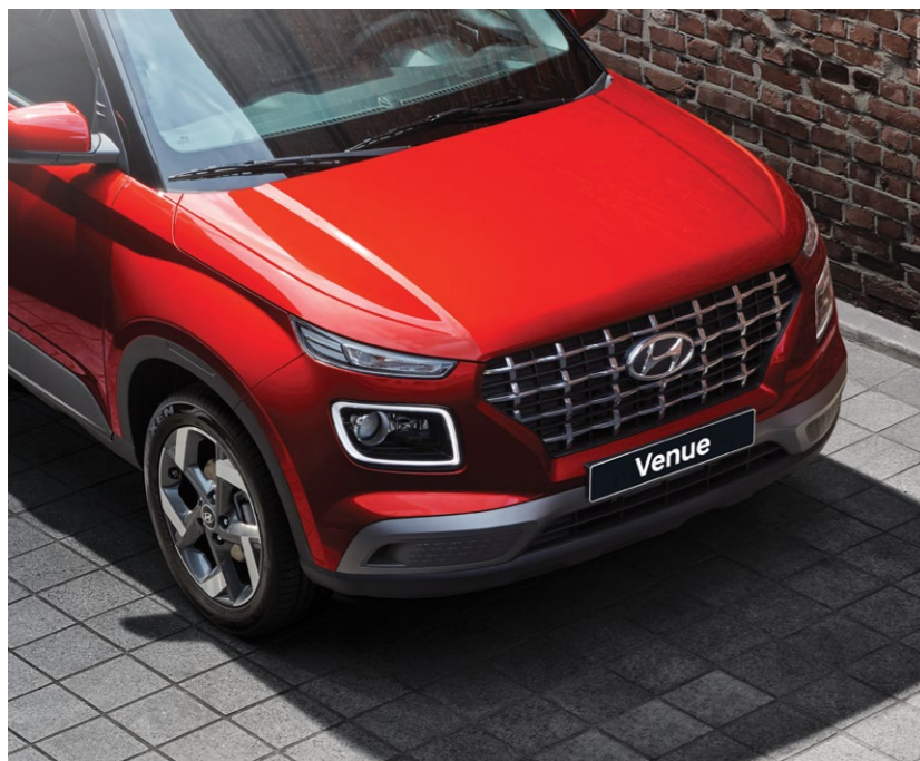
חזית במראה אגרסיבי עם גריל מעוצב*