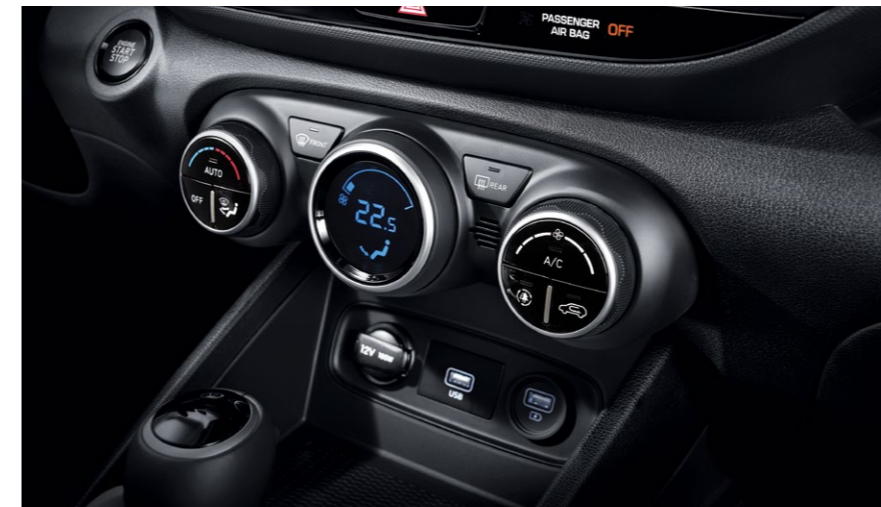
מערכת בקרת אקלים דיגיטלית**