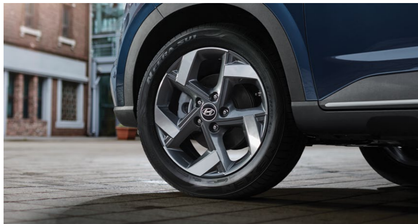
חישוקי סגסוגת 17*1

עם עיצוב חיצוני בולט הכולל גריל מעוצב עם עיטורי כרום* במראה אגרסיבי לצד פנסים מעודנים בקווים אלכסוניים.