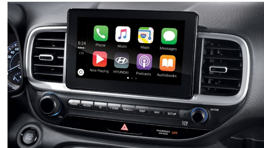
מערכת מולטימדיה מקורית 8" עם אפשרות חיבור למערכת *Android Auto, Apple Carplay