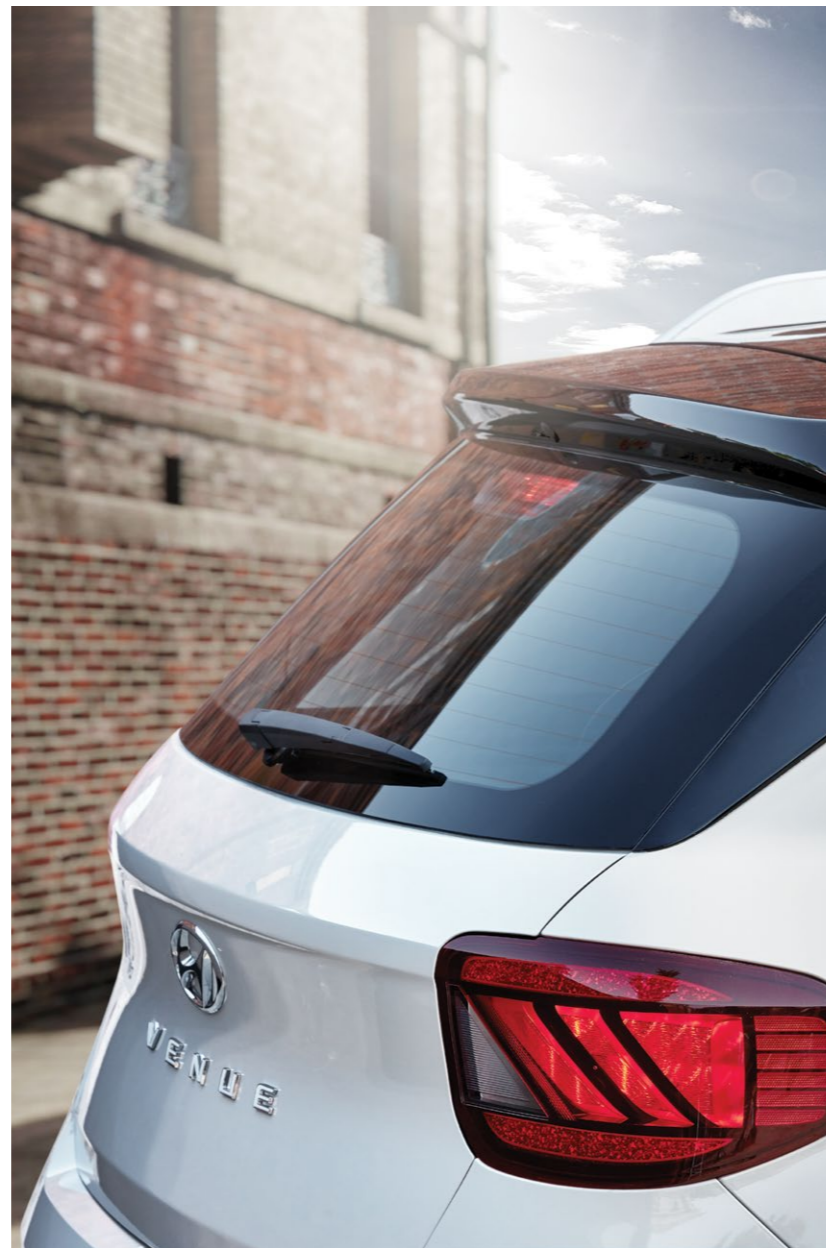
פנס אחורי בעל עדשה מעוצבת במראה אלכסוני