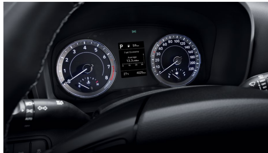
לוח מחוונים דיגיטלי 3.5"