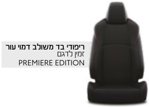
ריפודי בד משולב דמוי עור זמין לדגם PREMIERE EDITION