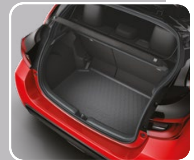
אמבטיה לתא המטען