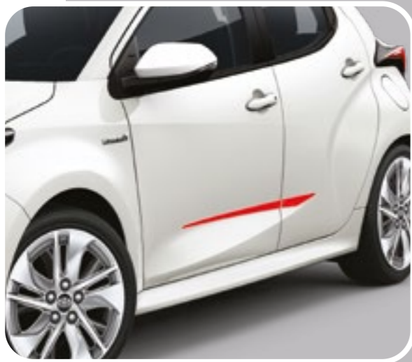
סט פסי קישוט בצבע אדום