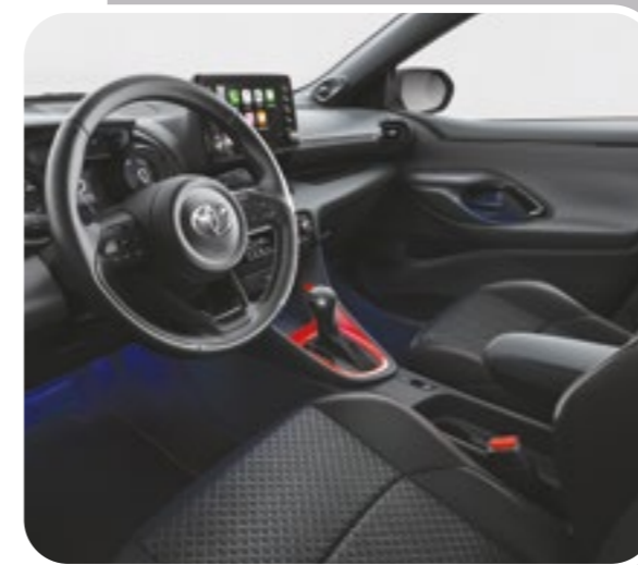
קישוט קונסולה מרכזית בצבע אדום