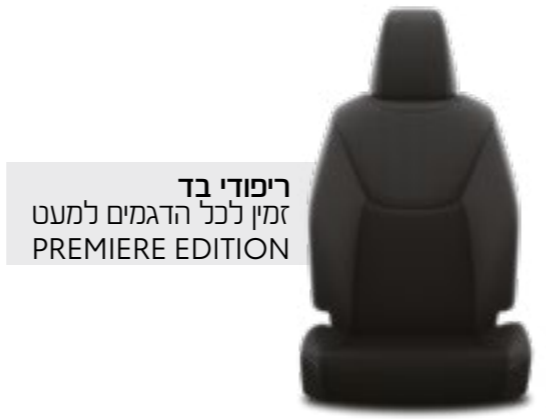
ריפודי בד זמין לכני הדגמים למעט PREMIERE EDITION