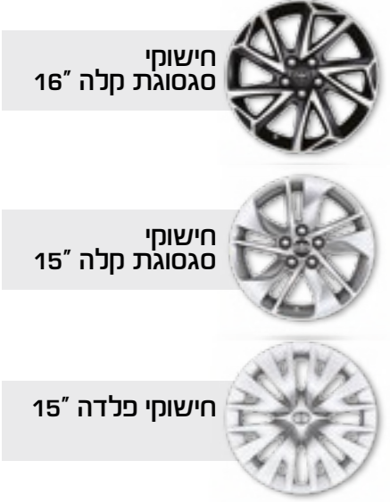
חישוקי סגסוגת קלה 16"