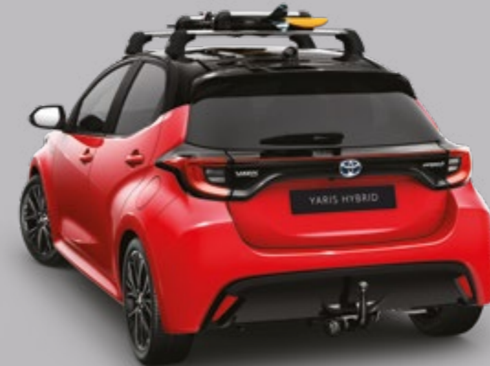
מוטות רוחב - סט של שניים