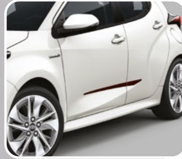
סט פסי הגנה שחורים לדלתות