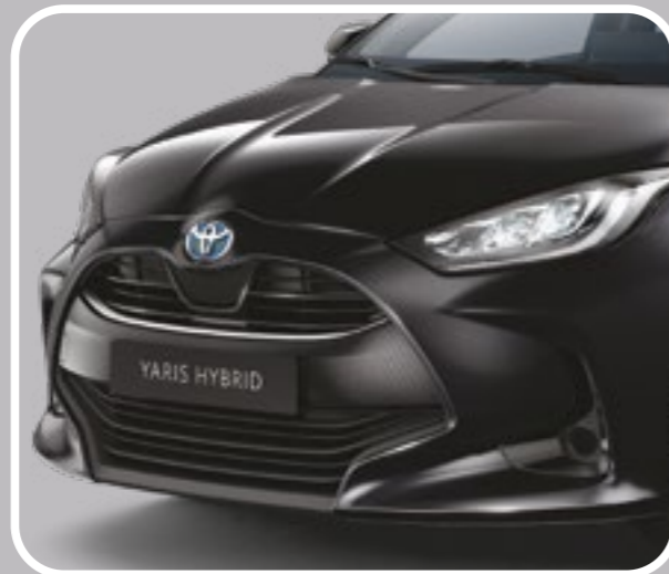
קישוט פגוש קדמי בצבע ניקל