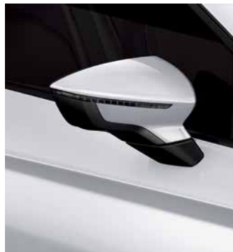
לבן נבאדה 2Y2Y