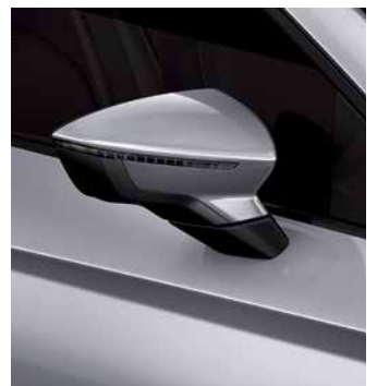
כסף מטאלי L5L5