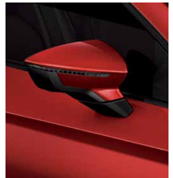
אדום כהה יין E1E1