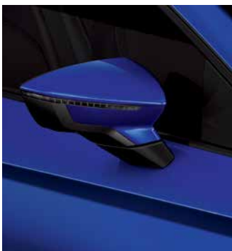
כחול קריסטל 7L7L