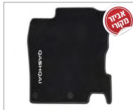
סט שטיחים תק"ט: LP00021549