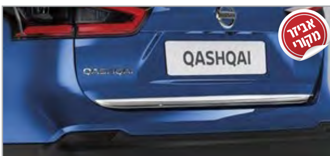
פסי קישוט תק"ט: LP00021642