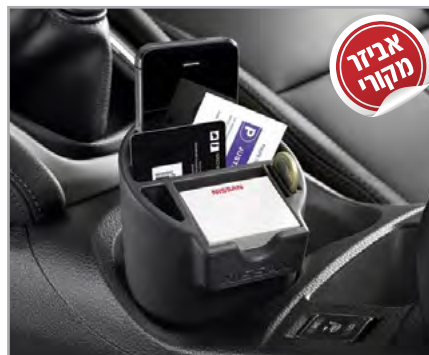
אירגונית תק"ט: LP00019710