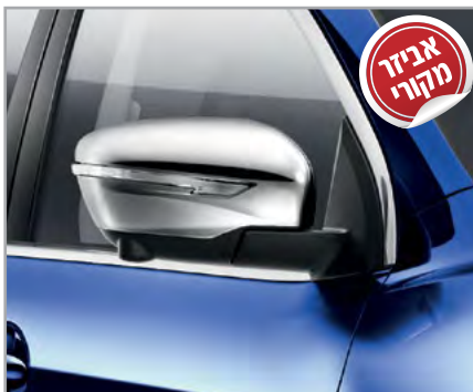
כיסוי מראות ice chrome תק"ט: LP00011609