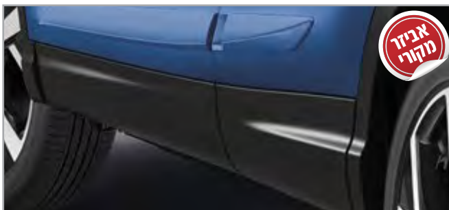
מגיני דלתות תק"ט: LP00011604