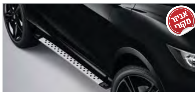
מדרכות צד תק"ט: LP00020664