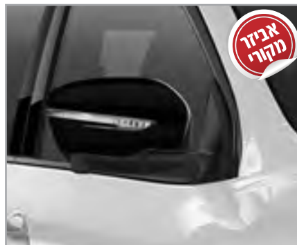
כיסוי מראות שחור מטאלי תק"ט: LP00021636