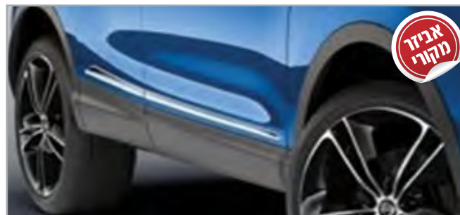
פס קישוט כרום ניקל מבריק תק"ט: LP00021648