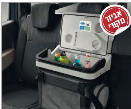
קירורית תק"ט: LP00011541