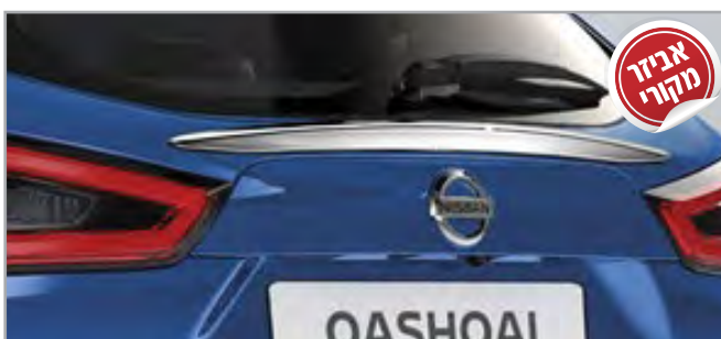
פסי קישוט תק"ט: LP00021640