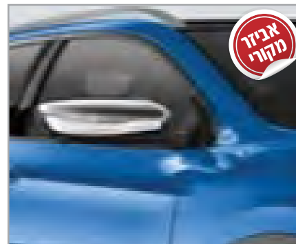
כיסוי מראות תק"ט: LP00021638