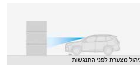
ניהול מצערת לפני התנגשות

התנועה לא זורמת תמיד בצורה חלקה, ולכן מערכת H Mj kw עושה יותר מאשר לשמור על מהירות קבועה. המערכת צופה לפניכם ומסייעת לכם באופן אוטומטי להתאים את מהירות הנסיעה והמרחק שלכם, גם בנהיגה עם עצירות והתחלות נסיעה תכופות.