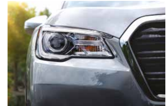
פנסים ראשיים LED עוקב פניה (VUK)

* Bluetooth ו-USB הוא סימן מסחרי של חברת Apple Inc. ** בחלק מרמות הגימור