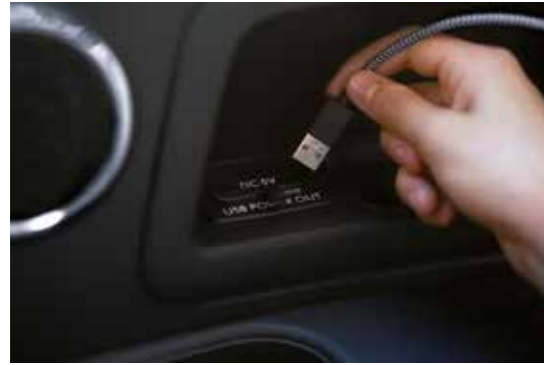
שקעי USB בשורת המושבים השלישית