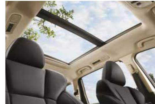
חלון שמש פנורמי בגג