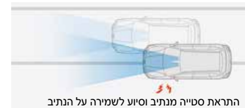
התראת סטייה מנתיב וסיוע לשמירה על הנתיב