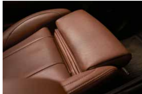
מושבים קדמיים מאווררים**