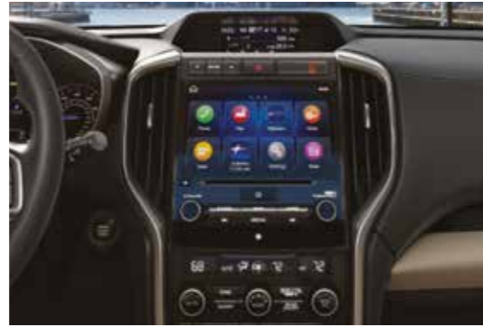
מולטימדיה 8" עם Bluetooth ו-USB