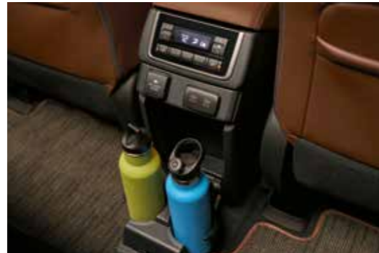
בקרת אקלים אוטומטית בשורת המושבים השנייה