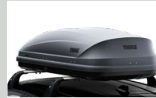
ארגז אחסון לגג הרכב