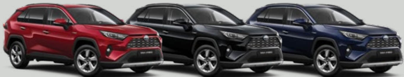
אדום רוז מטאלי 323