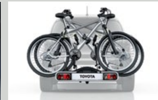
מתקן נשיאה לשני זוגות אופניים