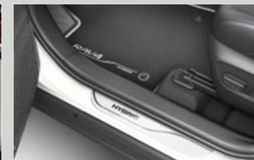
סט קישוטי סף לדלתות