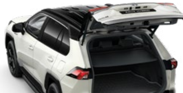
דלת תא מטען חשמלית*