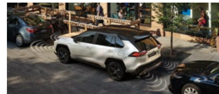
חיישני חניה אחוריים וקדמיים*