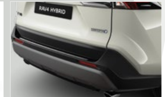
מגן שריטות לתא המטען