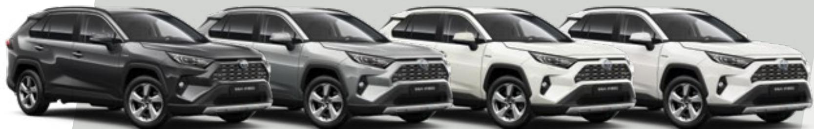
אפור כהה מטאלי