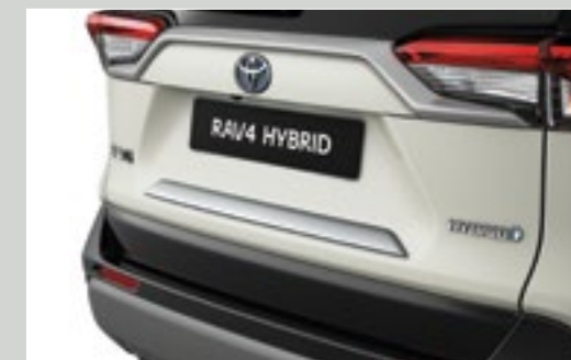
פס קישוט לתא המטען בצבע ניקל