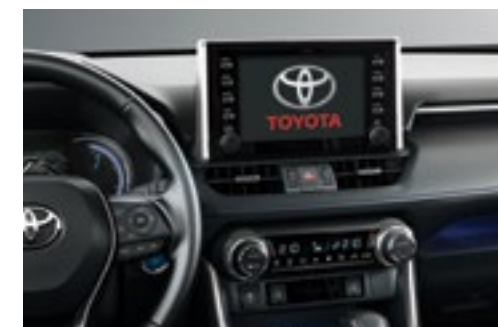
מערכת מולטימדיה "8 דוברת עברית