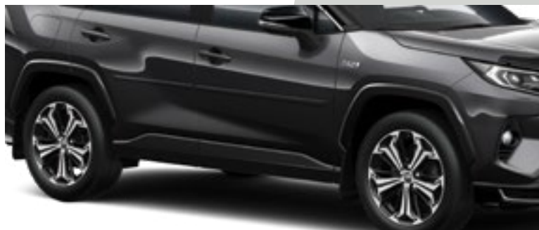
סט פסי הגנה לדלתות בצבע שחור ובצבע הרכב