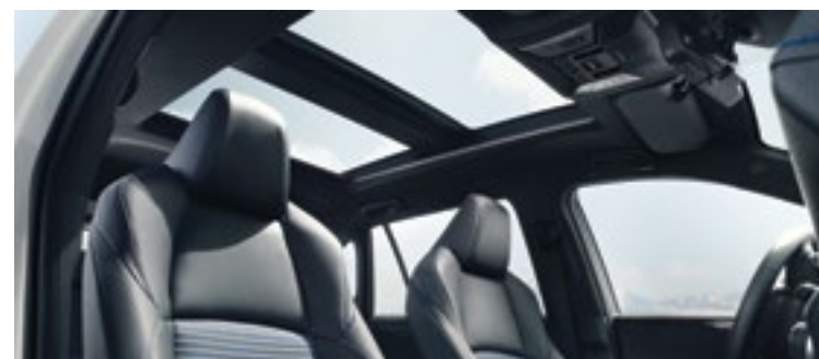
גג פנורמי (Panoramic roof)*

טכנולוגיה חכמה ומחוברת שמעוצבת לפי הדרישות והצרכים שלך