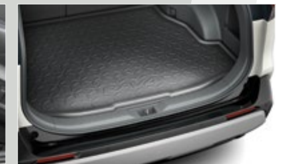
אמבטיה לתא המטען