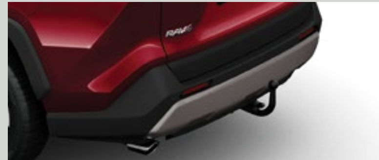
|| גרירה תפוח