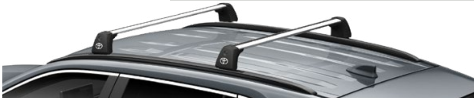
מוטות רוחב - לדגמים עם מוטות אורך בלבד