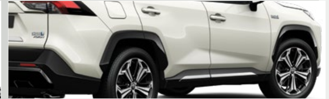
סט פסי קישוט לדלתות