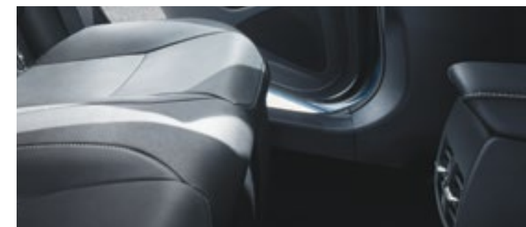
פתחי מיזוג אחוריים ליושבים במושב האחורי