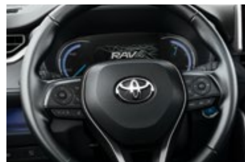
מסך נתונים צבעוני בלוח המחוונים *7*