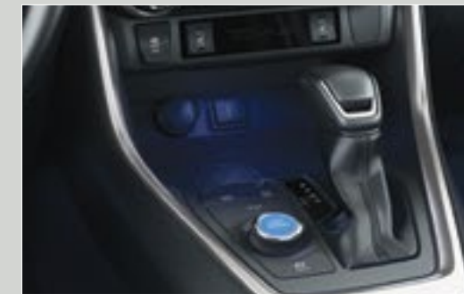
משטח טעינה אלחוטי לטלפון נייד*