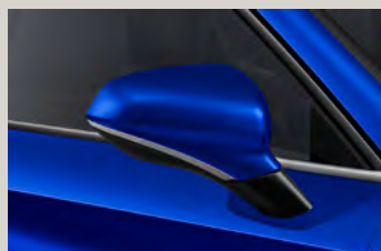
כחול קריסטל 7L7L