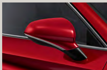
אדום כהה יין E1E1