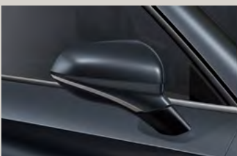
אפור מטאלי S7S7