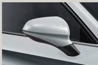
לבן נבאדה 2Y2Y