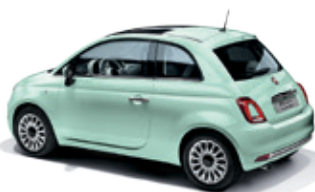
166 ירוק מילקשייק