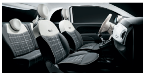
שנהב אפור - תפירה לבנה + הגה לבן