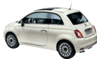
227 לבן קרח