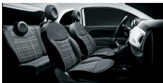
שחור אפור - תפירה לבנה + הגה שחור