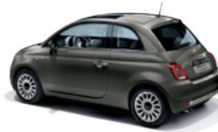
372 אפור חאקי