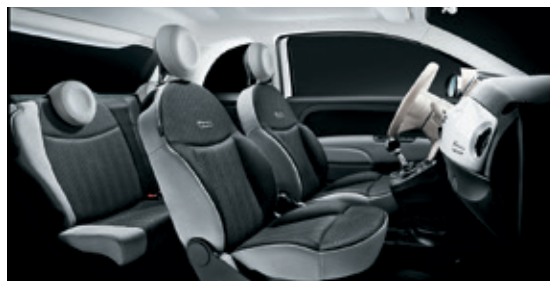
אפור כהה - מסגרת כסופה + הגה לבן