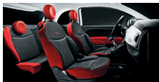
אפור כהה - מסגרת אדומה + הגה שחור