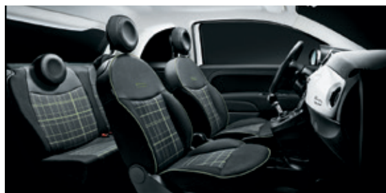
שחור אפור - תפירה ירוקה + הגה שחור