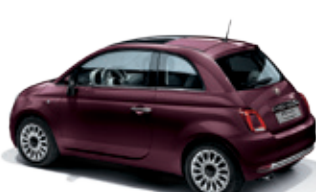
866 בורדו אוונגרד