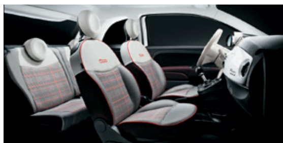
שנהב אפור - תפירה אדומה + הגה לבן