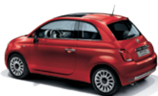
111 אדום פסטל