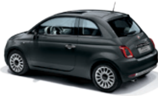
735 אפור לא צפוי