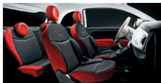
אפור כהה - מסגרת אדומה + הגה לבן