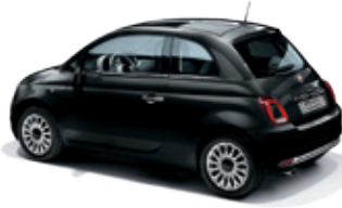
876 שחור אלגנטי