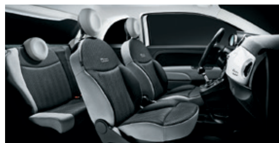
אפור כהה - מסגרת כסופה + הגה שחור