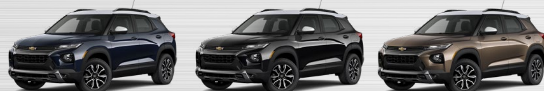
כחול כהה מטאלי (G5J) נג לבן שחור מטאלי (GB0) נג לבן ברונזה מטאלי (G7G) נג לבן