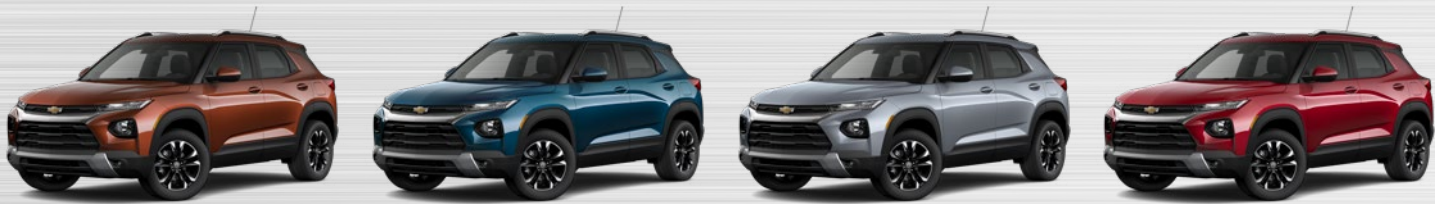
חום נחושת מטאלי (G8I) זמן ברמות גימור LTZ+, LTZ כחול ים מטאלי (GUM) זמן ברמות גימור LT+, LTZ אפור פלדה מטאלי (GYM) אדום מטאלי (GIL)