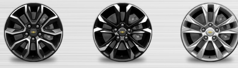
Activ Z (17") LT+ / LTZ (17") LS (17")