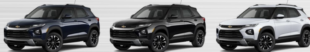
כחול כהה מטאלי (G5J) שחור מטאלי (GB0) לבן פסגה (GAZ)