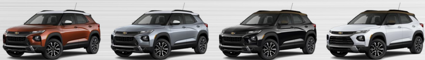
חום נחושת מטאלי (G8I) נג לבן אפור פלדה מטאלי (GYM) נג לבן שחור מטאלי (GB0) נג ברונזה לבן פסגה (GAZ) נג ברונזה