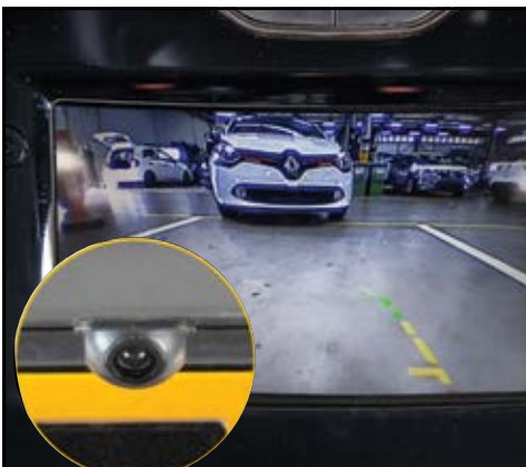
מתאם למצלמת רוורס מאפשר לראות עד מסך הרכב המקורי את המצלמה האחורית. LP000011583

אתה מוזמן לאבזר את הרכב שלך ולהפוך אותו לייחודי, עם מגוון אביזרים לבחירה: