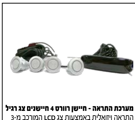
מערכת התראה - חיישן רוורס 4 חיישנים צג רגיל התראה ויזואלית באמצעות צג LCD המורכב מ-3 צבעים ובמרכזו צג דיגיטלי המציג את מרחק/טווח הנסיעה לאחור. LP00000021