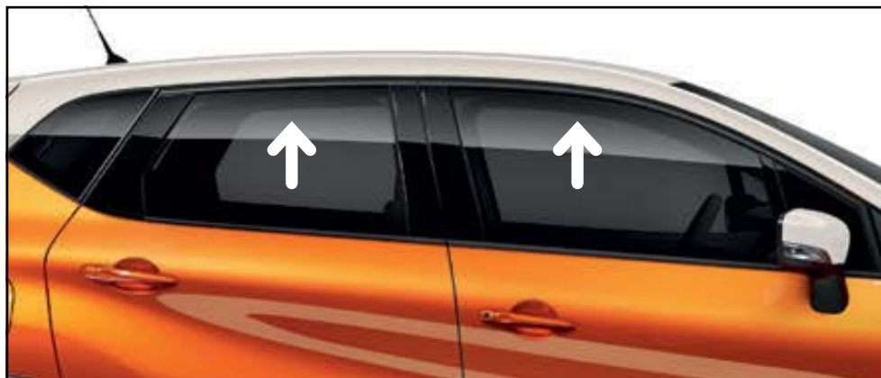
מרימי שמשות קדמי ואחורי + אופציה למקפל מראות מתאם להרמת שמשות הרכב ע"י לחיצה על שלט הרכב. אנטי טראפ. אופציה לתוספת קיפול מראות. LP00020107/20880