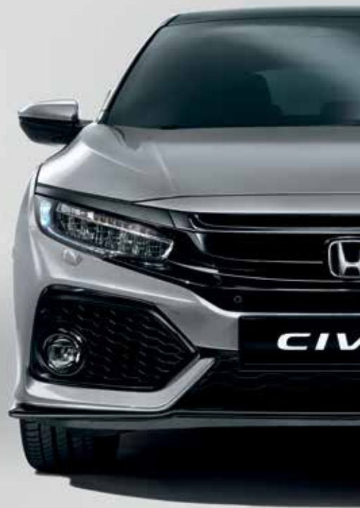
LUNAR SILVER METALLIC