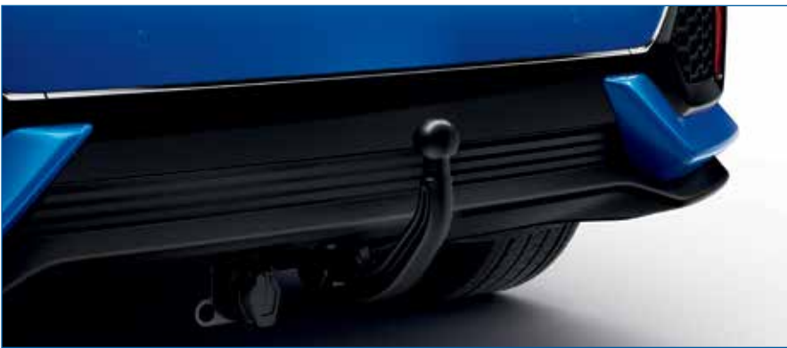
וו גרירה - לדגם 1.0 ל' בלבד