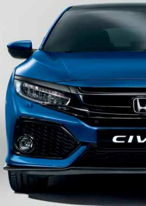
BRILLIANT SPORTY BLUE METALLIC