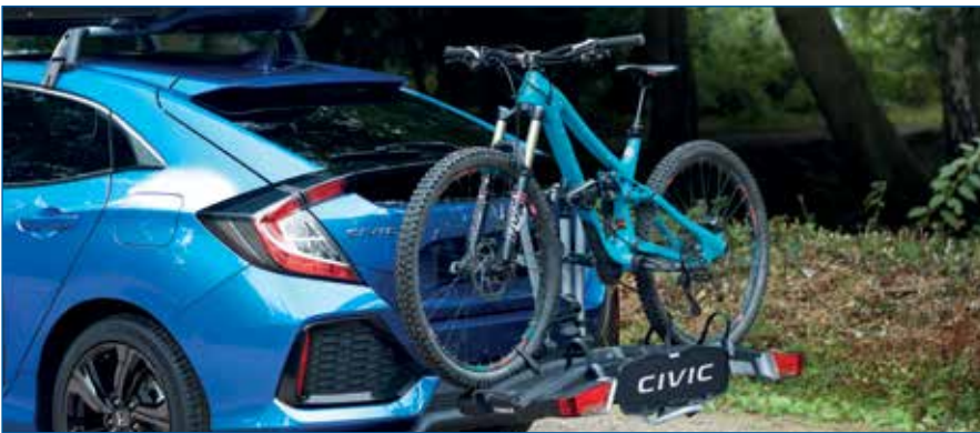
מתקן לאופניים - לדגם 1.0 ל' בלבד