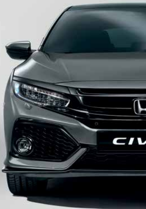
POLISHED METAL METALLIC