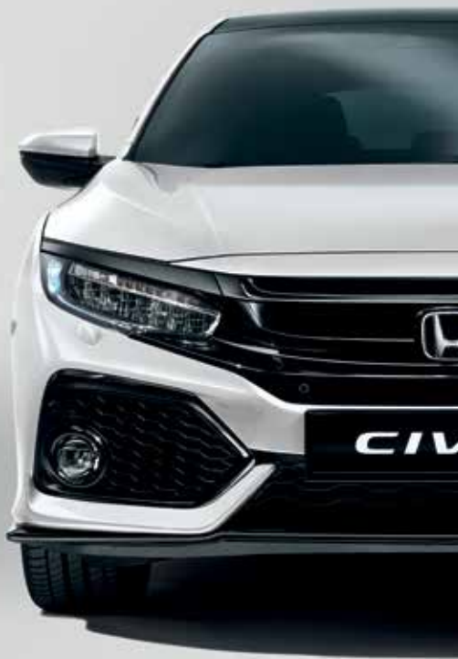
WHITE ORCHID PEARL