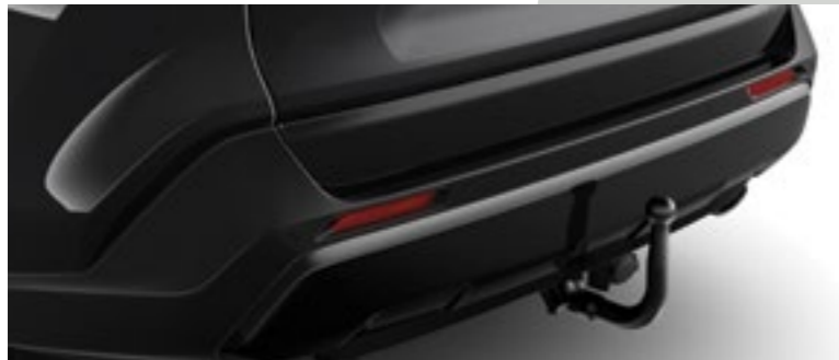
|| גרירה נשלף