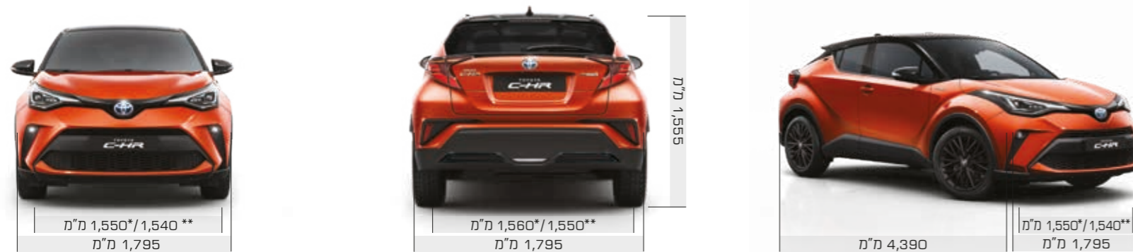
דגמים C-ITY, C-LUB **מתייחס לדגמים C-HIC, C-ONCEPT, LAUNCH EDITION