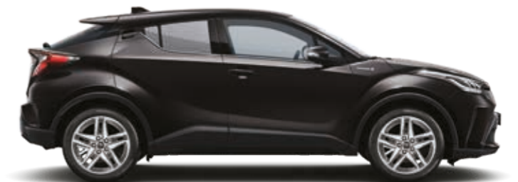
שחור נואר מטאלי 209