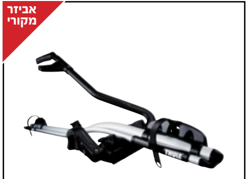
מנשא אופניים THULE אלומיניום דגם 591 לאופניים עם קוטר שלדה בין 22 ל-80 מ"מ. LP00007132