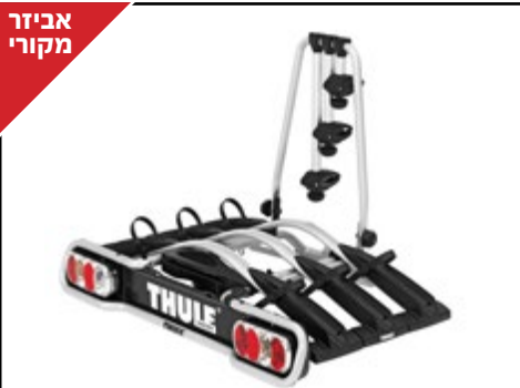
מנשא אופניים לוו גרירה THULE EUROWAY לאופניים עם קוטר שלדה בין 22 ל-80 מ"מ. הטיה של המנשא לגישה קלה לתא מטען. LP00013756 - זוגות 2 / LP00013758 - זוגות 3