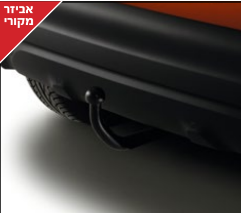
התקן גרר נשלף/קבוע בעל תאימות מלאה לרכב. LP00013762/LP00019414