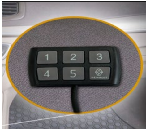
קודן משבת התנעה חכם למניעת גניבות. LP00000045