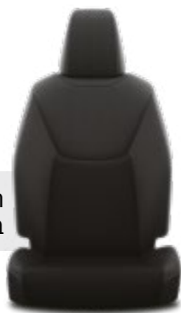
ריפודי בד בצבע שחור