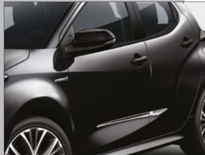
סט פסי קישוט בצבע כרום