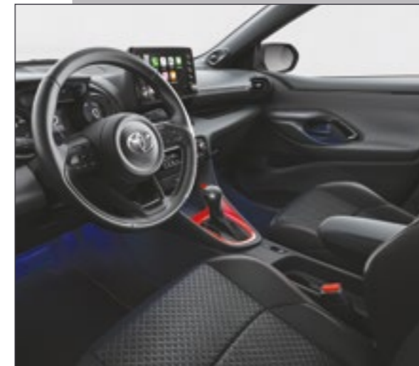
קישוט קונסולה מרכזית בצבע אדום