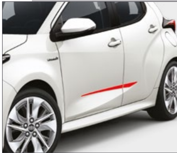
סט פסי קישוט בצבע אדום