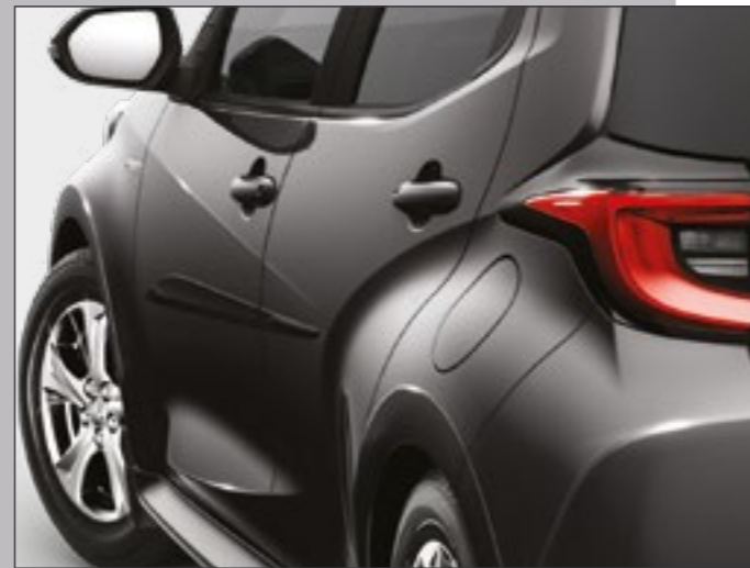
סט פסי הגנה שחורים לדלתות