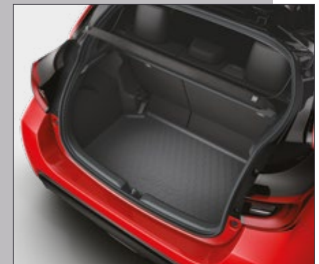
אמבטיה לתא המטען