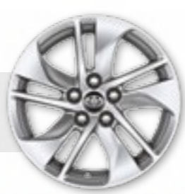
חישוקי סגסוגת קלה 15"