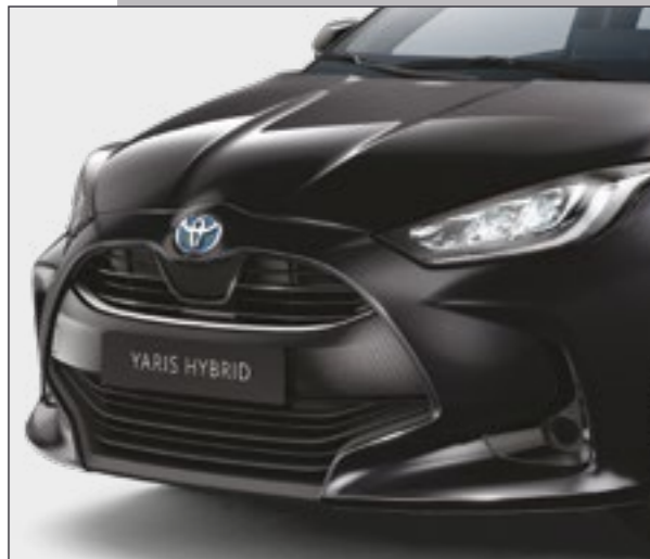
קישוט פגוש קדמי בצבע ניקל