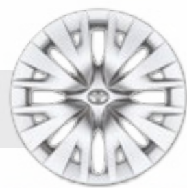
חישוקי פלדה 15"

*מומלץ לבדוק את תאימות הטלפון הנייד שברשותך למערכת ה-Bluetooth המותקנת ב-YARIS, אשר הינה מסוג Toyota Touch 2. את הבדיקה ניתן לעשות בלינק הבא: www.toyota-tech.eu/bluetooth/search.aspx **נכון למועד פרסום קטלוג זה, אפליקציית Android Auto אינה זמינה בישראל. ***פעילות ה-E-call תלויה ברשת הסלולרית הנמצאת בקרבת הרכב בעת שידור המידע.