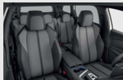
ריפוד פנימי וגימור דלתות בצבע אפור כהה