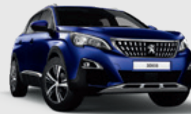
MAGNETIC BLUE | כחול ים מטאלי EGM0