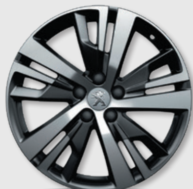
חישוק סגסוגת "DETROIT 18" סטנדרט לדגמי ACTIVE ולדגמי 1.2 PREMIUM ל'