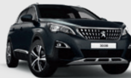
HURRICANE GREY | אפור כהה 9GP0