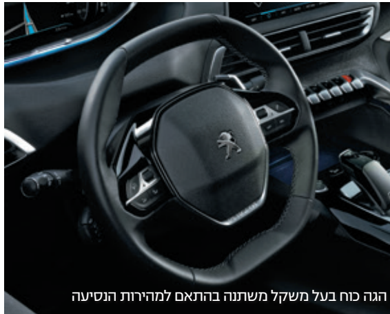
הגה כוח בעל משקל משתנה בהתאם למהירות הנסיעה