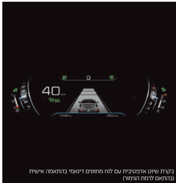
בקרת שיט אדפטיבית עם לוח מחוונים דינמי בהתאמה אישית (בהתאם לרמת הגימור)