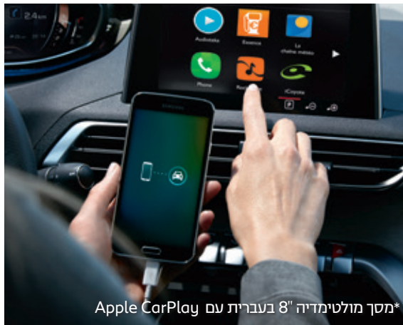
*מסך מולטימדיה 8" בעברית עם Apple CarPlay