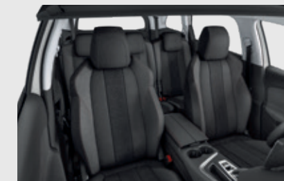
ריפוד פנימי וגימור דלתות בצבע אפור כהה