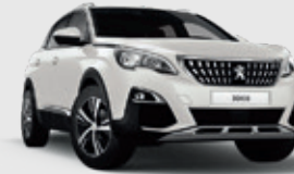
WHITE PEARLESCENT | לבן פנינה מטאלי M6N9