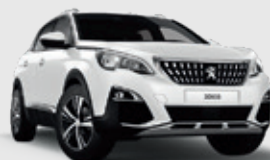
BANQUISE | לבן WPP0