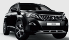
PERLA NERA BLACK | שחור מטאלי 9VM0