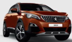
METALLIC COPPER | חום מטאלי LGM0