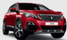
ULTIMATE RED | אדום כהה מטאלי F3M5