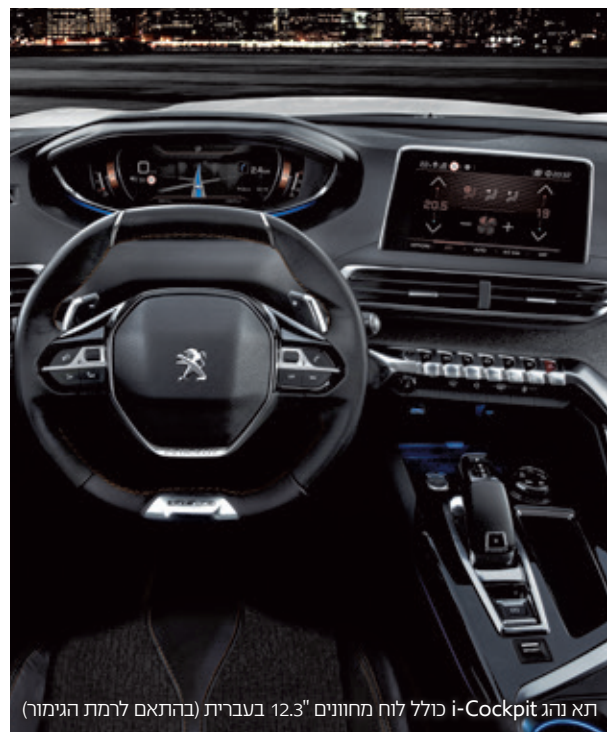
תא נהג i-Cockpit כולל לוח מחוונים 12.3" בעברית (בהתאם לרמת הגימור)