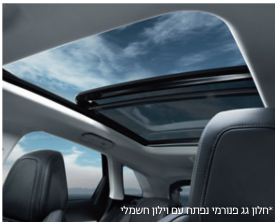
*חלון גג פנורמי נפתח עם וילון חשמלי