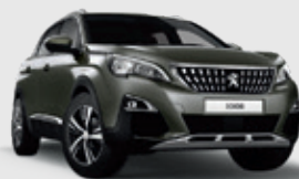
AMAZONITE GREY | אפור ירקרק מטאלי KLM0