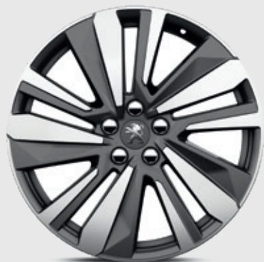
חישוק סגסוגת "WASHINGTON 19" סטנדרט לדגמי 1.5 GT/PREMIUM ו-1.6 ל' ולדגמי ה-PHEV