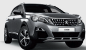
ARTENSE GREY | כסוף כהה מטאלי F4M0