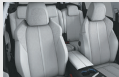
ריפוד פנימי וגימור דלתות בצבע אפור בהיר