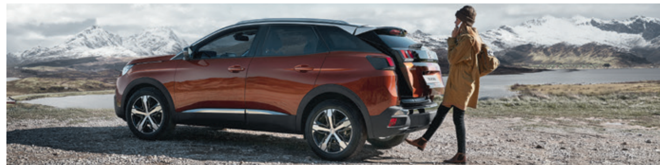
פתיחת וסגירת תא המטען באופן חשמלי באמצעות חיישן המזהה תנועת רגל מתחת לפגוש האחורי (בהתאם לרמת הגימור)