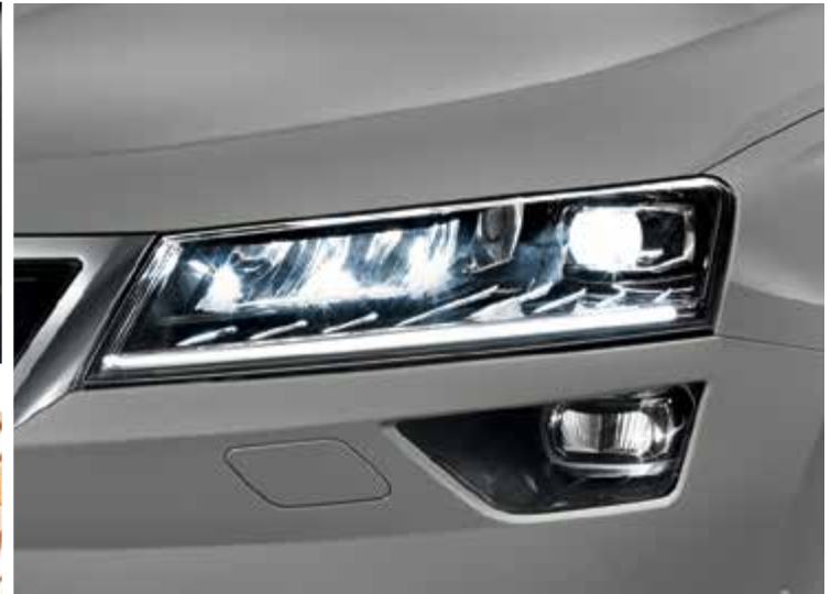
פנסים קדמיים Full LED