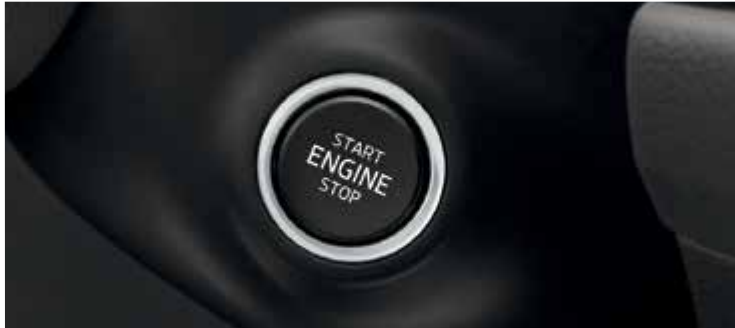
מערכת Kessy - כניסה והנעה ללא מפתח