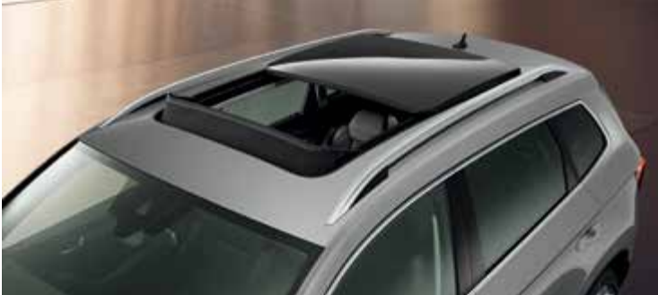
גג שמש פנורמי עם פתיחה חשמלית