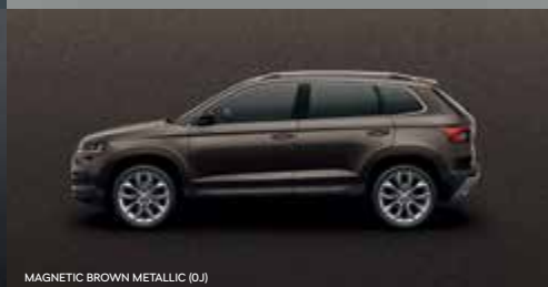
MAGNETIC BROWN METALLIC (0J)