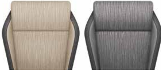
ריפודי בד - שחור / ב'ל