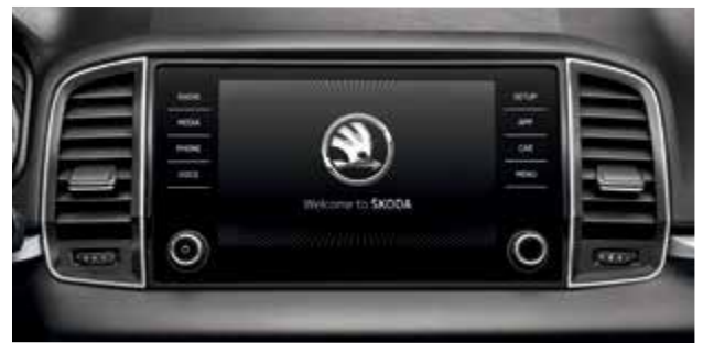
מערכת מולטימדיה מקורית בעלת מסך בגודל 8"