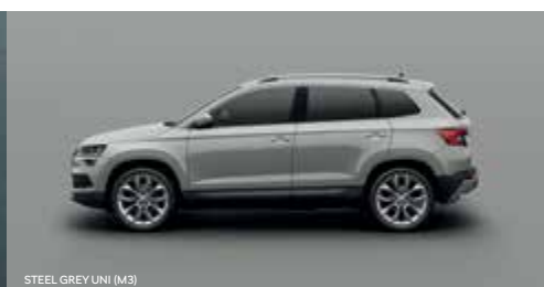
STEEL GREY UNI (M3)