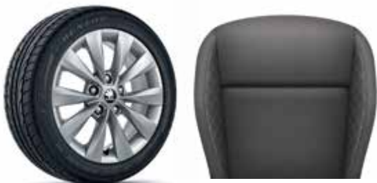
חישוקי סגסוגת 16"