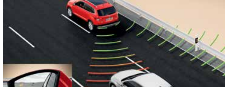
מערכת Blind spot detect