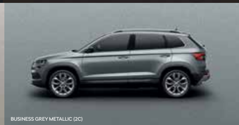
BUSINESS GREY METALLIC (2C)