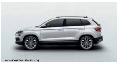
MOON WHITH METALLIC (2Y)