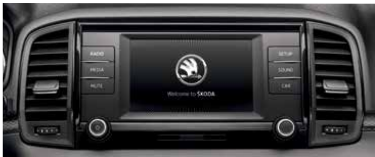
מערכת מולטימדיה מקורית בעלת מסך בגודל 6.5"