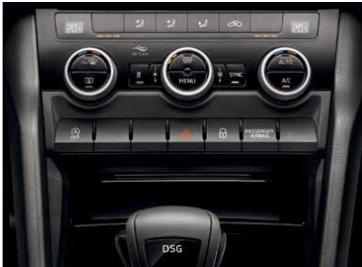
מערכת בקרת אקלים דיגיטלית - Climatronic בעלת 2 אזורים