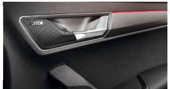
מערכת שמע Canton הכוללת 10 רמקולים