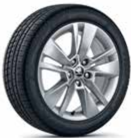
חישוקי סגסוגת 17"