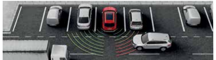
מערכת אקטיבית Rear traffic alert