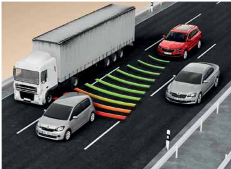
בקרת שיוט אדפטיבית - Adaptive cruise control