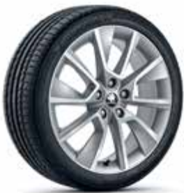
חישוקי סגסוגת 18"