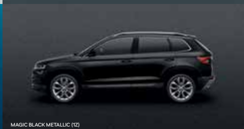
MAGIC BLACK METALLIC (1Z)