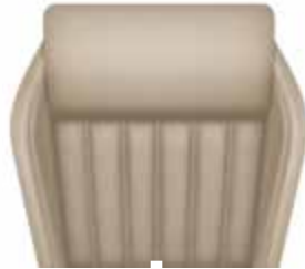
ריפוד מושבים מעור / אלקנטרה