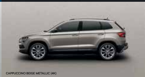
CAPPUCCINO BEIGE METALLIC (4K)