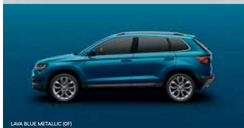
LAVA BLUE METALLIC (0F)