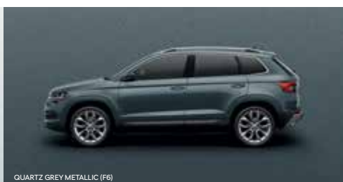
QUARTZ GREY METALLIC (F6)