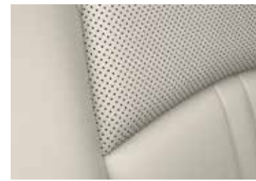
ריפוד עור לבן Pure White עם תפרים תואמים ברמת גימור Pure White