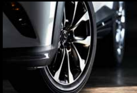
חישוק סגסוגת קלה 18" אלומיניום מוברש