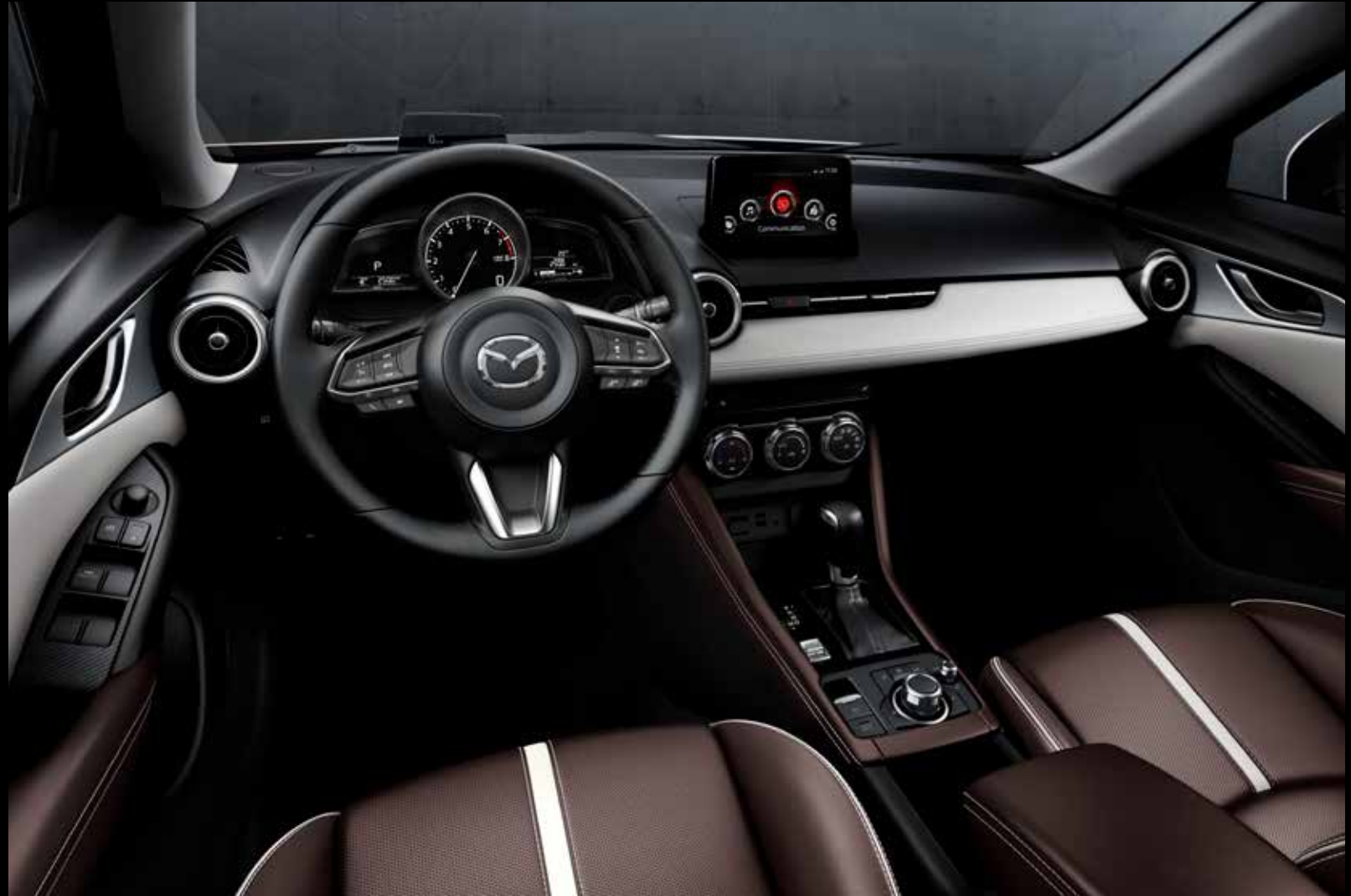
ריפוד עור Nappa חום עם תפרים בהירים ופס קישוט לבן