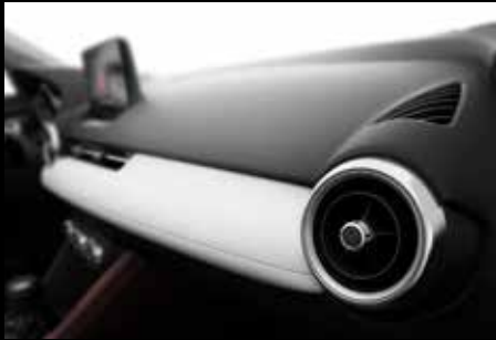
גימור רך לבן עם תפרים תואמים. פתחי אוורור בגימור כרום עם טבעת קישוט לבנה

- מושב נהג חשמלי עם זכרונות - גימור פנימי רך לבן עם תפרים תואמים בלוח המכשירים. - במשענת היד, בדלתות ובצדי הקונסולה המרכזית משולב גימור רך חום - חיפוי דלתות פנימי דמוי עור לבן