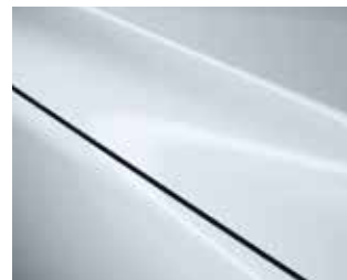
לבן קרמי (47A)