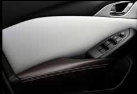
חיפוי דלתות דמוי עור לבן בשילוב חום עם תפרים תואמים