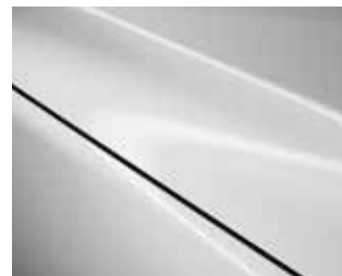
לבן פנינה (25D)