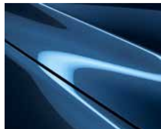
כחול נצחי (45B)