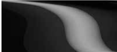
שחור סילון (41W)