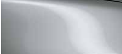
כסף סוניק (45P)