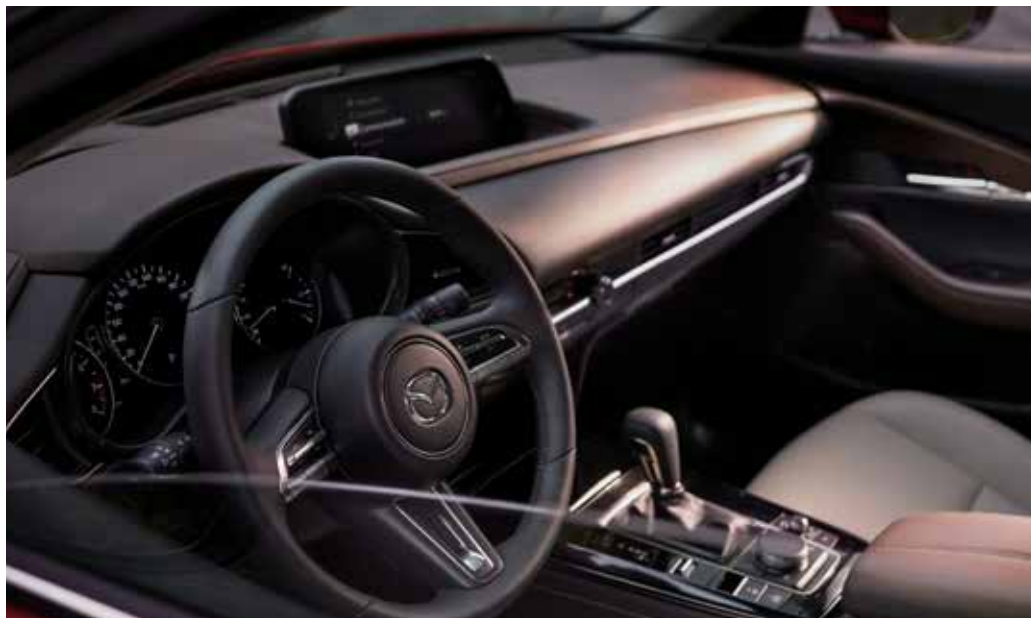
גימורים פנימיים בצבע חום בדלתות ובשידה המרכזית בשילוב עם ריפודי עור (שחור או לבן) ברמת גימור Premium