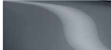
כחול מתכתי (47C)