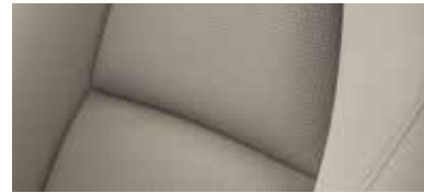
ריפוד בד שחור / בז' ברמות גימור Executive-1 Comfort