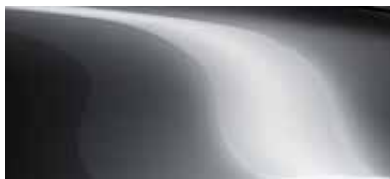
אפור עשיר (46G)*