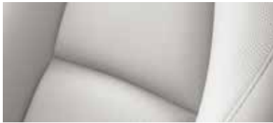
ריפוד עור שחור / לבן Pure White ברמת גימור Premium