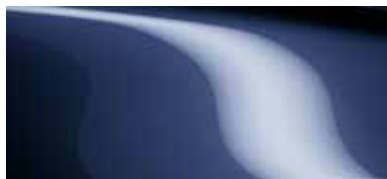
כחול קריסטל כהה (42M)