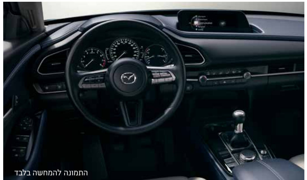
התמונה להמחשה בלבד גימורים פנימיים בצבע כהה בדלתות ובשידה המרכזית בשילוב עם ריפודי בד (שחור או בז') ברמות גימור Executive-1 Comfort