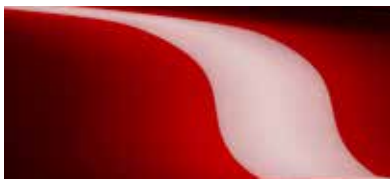
אדום עשיר נוצץ (46V)*