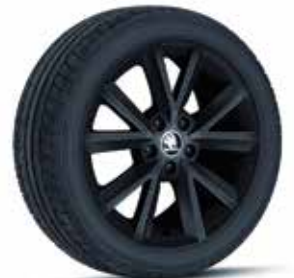
שחור (בשילוב עם גג שחור)