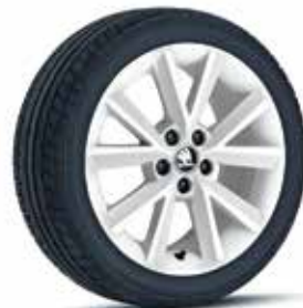
לבן (בשילוב עם גג לבן)