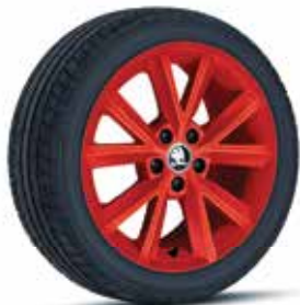
אדום (בשילוב עם גג אדום)