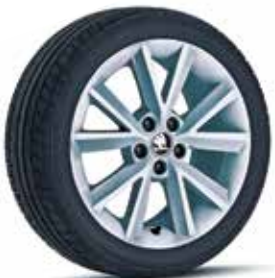
כסף (בשילוב עם גג כסף)