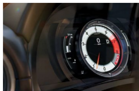
*התמונות להמחשה בלבד. ט.ל.ח.