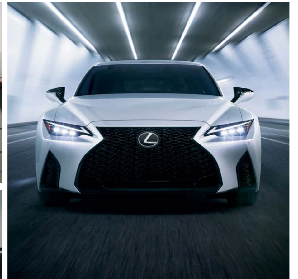
*התמונות להמחשה בלבד. ט.ל.ח.