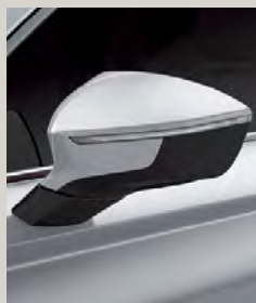
לבן נאבדה 2Y2Y