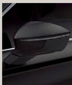
שחור פנינה 6J6J