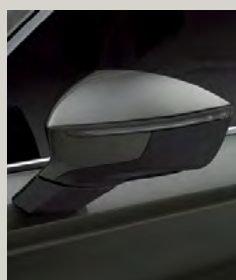
ירוק קמפלאז' 9S9S