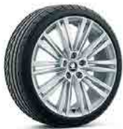
רמת גימור L&K TSI (190) "19