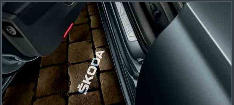
הקרנת הלוגו "SKODA" על הקרקע