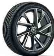
רמת גימור Sportline "19