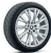
רמת גימור Style "18