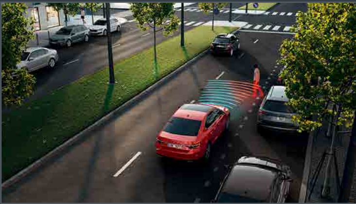
מערכת Front assist