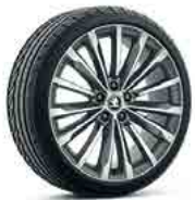
רמת גימור L&K TSI (272) "19