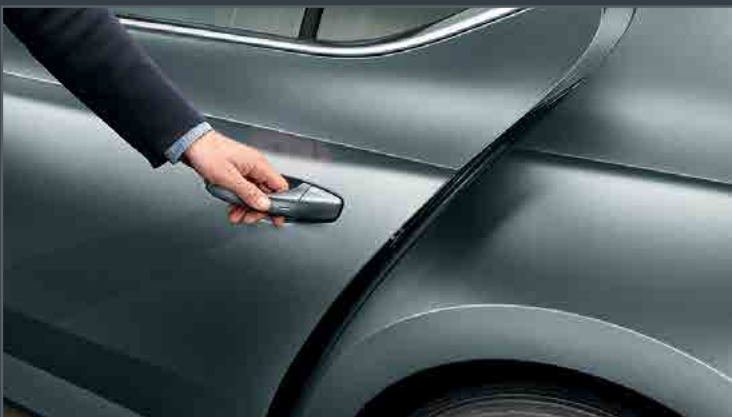
מערכת Kessy בכל הדלתות