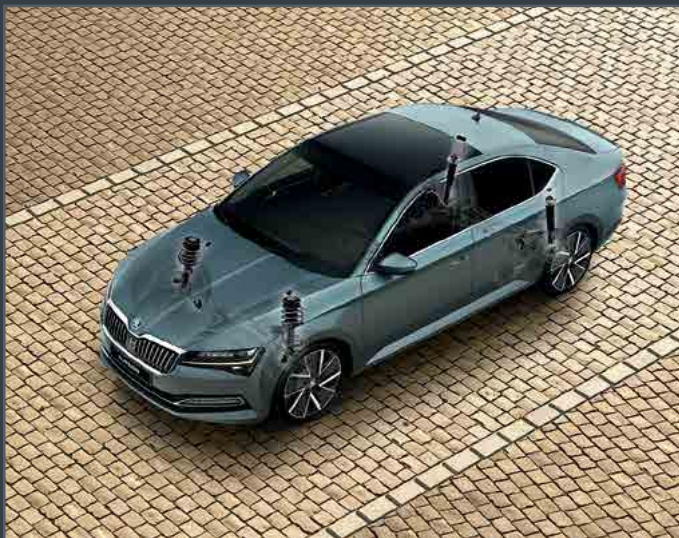
בקרת שלדה דינמית (DCC)