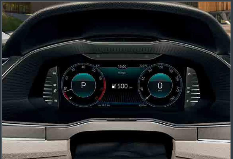
לוח מחוונים דיגיטלי