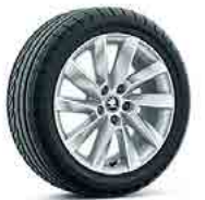
רמת גימור Ambition "17