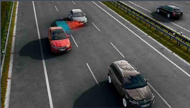
מערכת Side assist