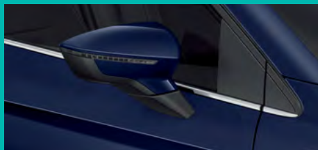
2. 9550 כחול