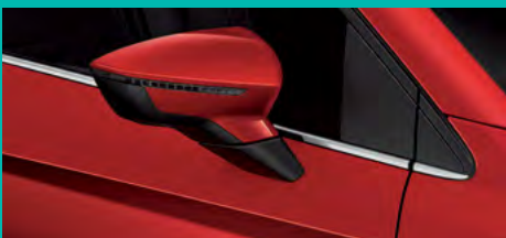
9. E1E1 אדום כהה יין