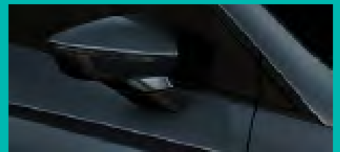
4. S7S7 אפור