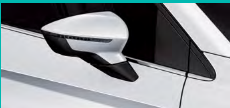
6. 2727 לבן נבאדה