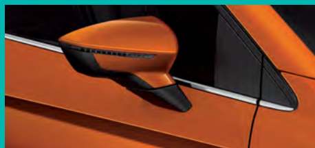
8. F5F5 כתום