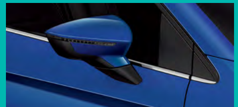
1. 7777 כחול קריסטל