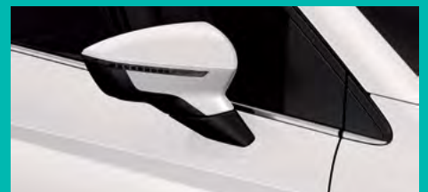
7. B4B4 לבן