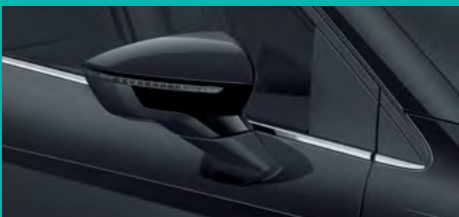
3. SE0E שחור