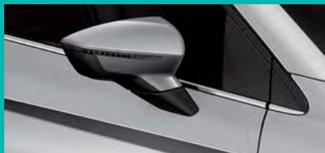
5. L5L5 מטאלי כסף