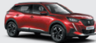
ELIXIR RED | VHM5 | אדום מטאלי