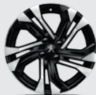
חישוקי סגסוגת 17" SALAMANCA בדגמי PREMIUM/GT

לרשותך עומד מגוון רחב של צבעים שיאפשר לך להביע את עצמך באופן מלא.