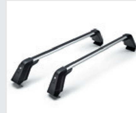
מוטות רחב (על גג הרכב)