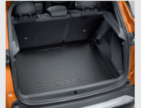
משטח פלסטיק לתא מטען