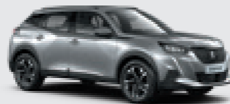
ARTENSE GREY | F4M0 | כסוף כהה מטאלי