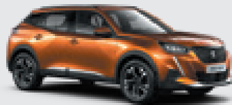
ORANGE FUSION | 2SM0 | כתום מטאלי