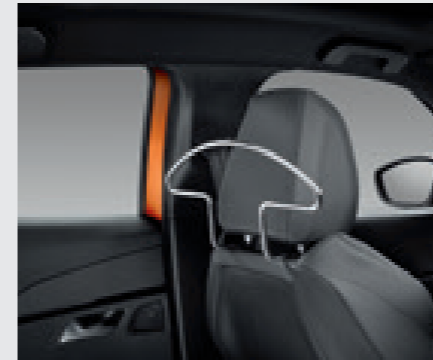
סט קולבים למשענות הראש הקדמיות