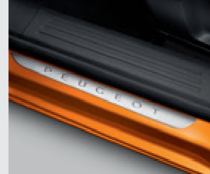
סט ספי דלת