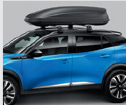
מגוון תאי אחסון עילאיים לבחירה