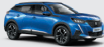
VERTIGO BLUE | SMM6 | כחול פנינה מטאלי