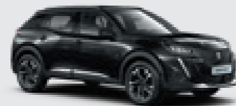
ONYX BLACK | XYP0 | שחור