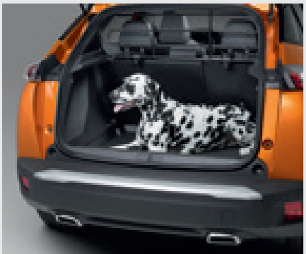
גריל הפרדה לתא מטען