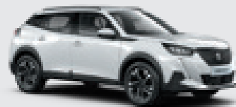
BANQUISE | WPP0 | לבן בנקיז