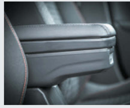
משענת יד אמצעית*