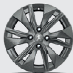
חישוקי סגסוגת 16" ELBORN בדגמי ACTIVE