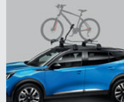
מנשא לאופניים (נדרש מוטות רחב)