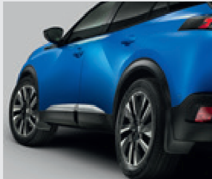
סט מגני בוץ (קדמיים + אחוריים)