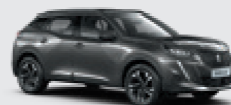
PLATINIUM GREY | VLM0 | אפור כהה מטאלי * רק בדגמי הבניין/דיזל