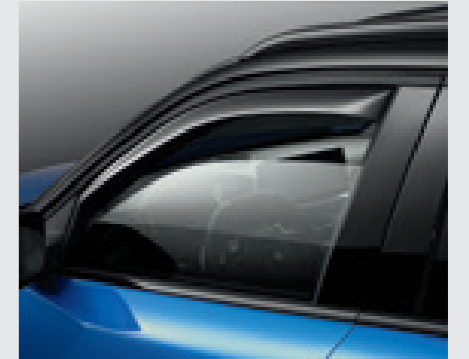
סט מסיטי רוח לחלונות הקדמיים