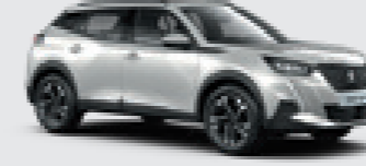
PEARLESCENT WHITE | N9M6 | לבן פנינה מטאלי