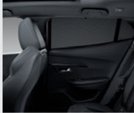
סט רשתות הצללה*