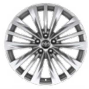
חישוקי סגסוגת קלה 20" בדגם E-XCLUSIVE 4X4 בלבד.