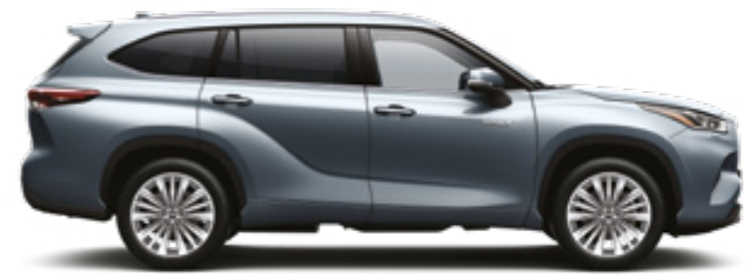
1K5 כחול טיטניום מטאלי*