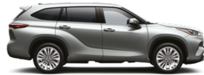
1J9 כסוף מטאלי