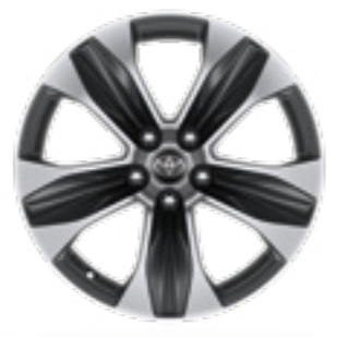
חישוקי סגסוגת קלה 18" בדגם E-MOTION 4X4 בלבד.