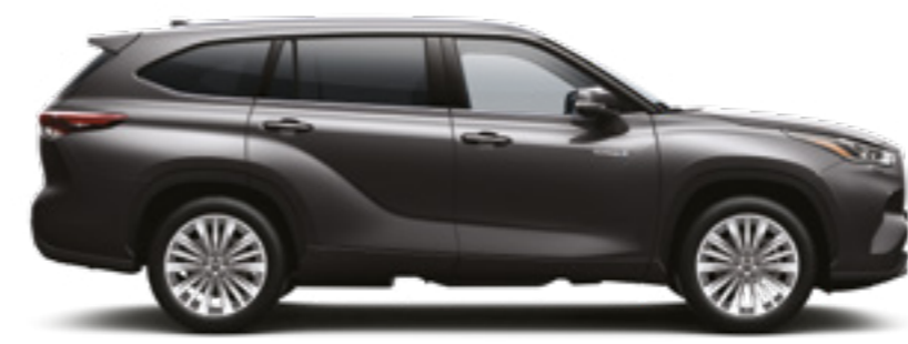
1G3 אפור כהה מטאלי