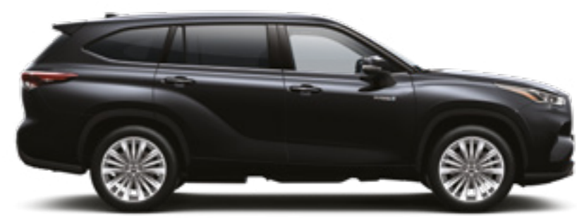
218 שחור מיקה מטאלי