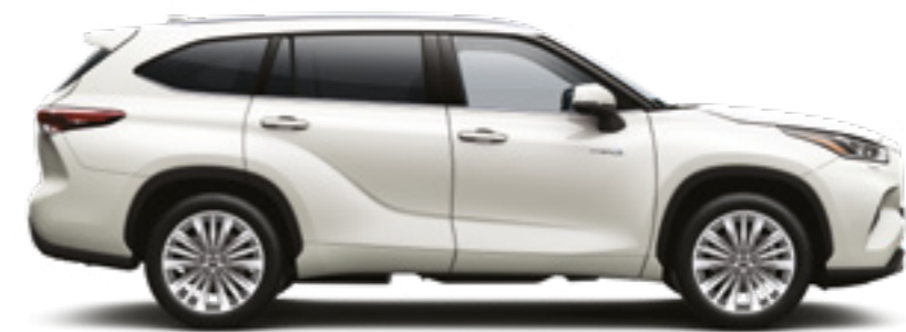
070 לבן פנינה מטאלי