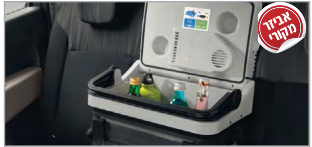
קירורית מק"ט: LP00011541