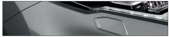
KAD אפור מטאלי