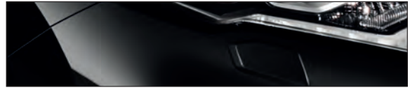
G41 שחור מטאלי