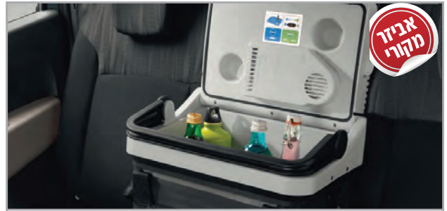
קירורית מק"ט: LP00011541