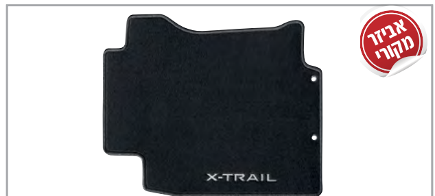
שטיחי לבד מהודרים מק"ט: LP00021904