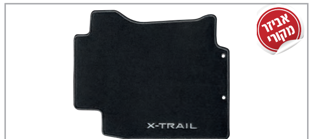
שטיחי לבד מהודרים מק"ט: LP00021904