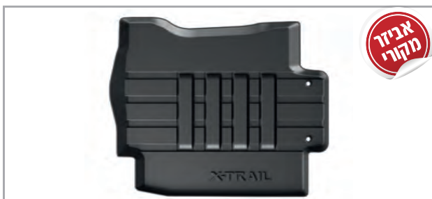
שטיחי גומי מק"ט: LP00021604