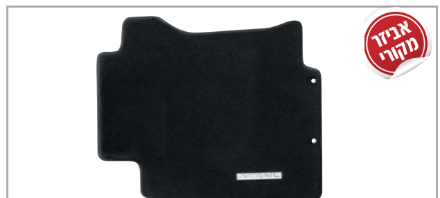
שטיחי לבד מהודרים בגימור שחור מק"ט: LP-00021906