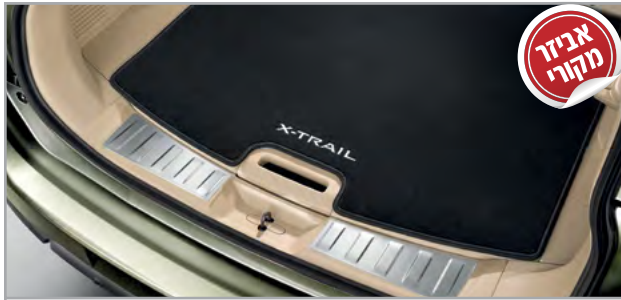
מדרך סף דלת תא מטען מק"ט: LP00021907