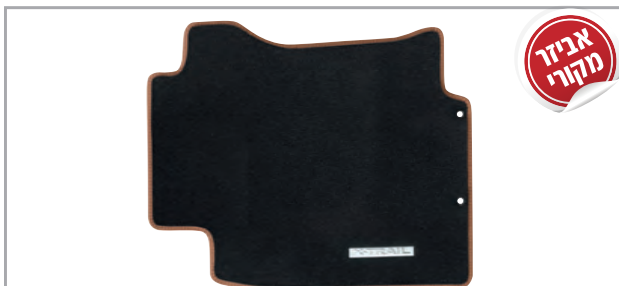
שטיחי לבד מהודרים בגימור חום מק"ט: LP-00021905