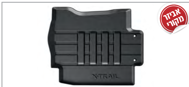
שטיחי גומי מק"ט: LP00021604