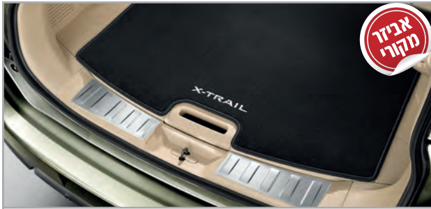
מדרך סף דלת תא מטען מק"ט: LP00021907