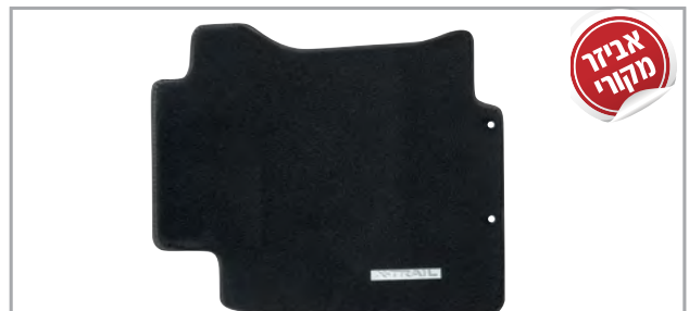
שטיחי לבד מהודרים בגימור שחור מק"ט: LP-00021906