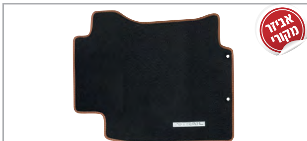
שטיחי לבד מהודרים בגימור חום מק"ט: LP-00021905