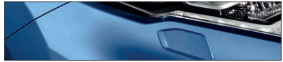
RAW כחול ספיר מטאלי