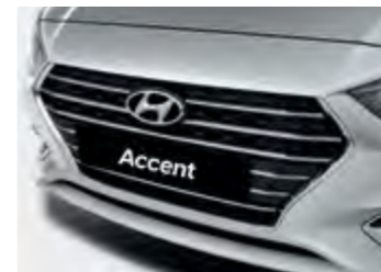
שבכה קדמית מעוצבת