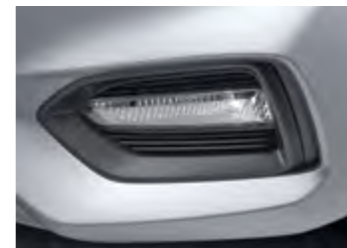
פנסי DRL יום