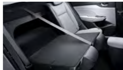
מושבים מתקפלים (ביחס 40:60)