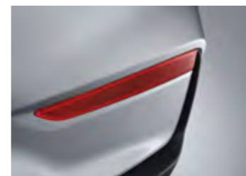
מחזיר אור אחורי מובנה