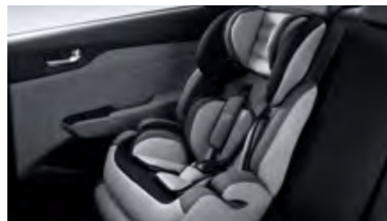
מנגנון עיגון מושב ילדים ISOFIX