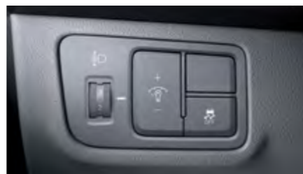
בקרת יציבות אלקטרונית