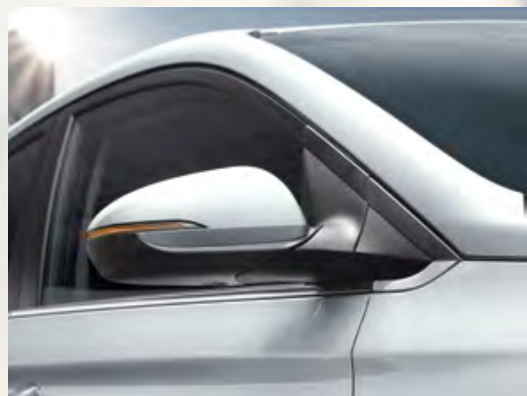
איתות במראות צד