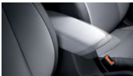
משענת יד מתכווננת