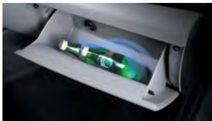
תא כפפות עם קירור