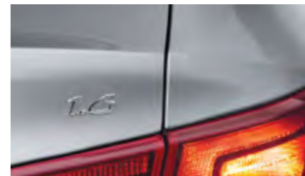
פנסים אחוריים מעוצבים