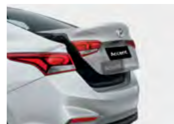
פתיחת תא מטען מהשלט