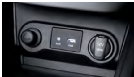
חיבוריות 12V USB/AUX