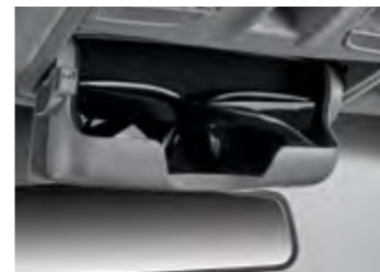
תא למשקפי שמש