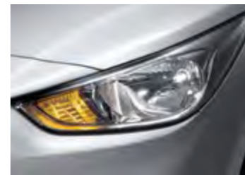
פנסי הלוגן ראשיים