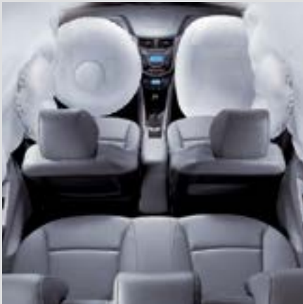
מערכת כריות אוויר

אתם יכולים לבלום בביטחון מלא! מערכת ה-ABS מונעת את נעילת הגלגלים, ומסייעת לרכב לשמור על נתיב הנסיעה גם על משטחים חלקים ובעת פנייה - לנהיגה בטוחה יותר.