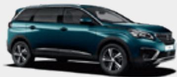
Emerald Crystal | DZM0 | כחול טורקיז מטאלי |