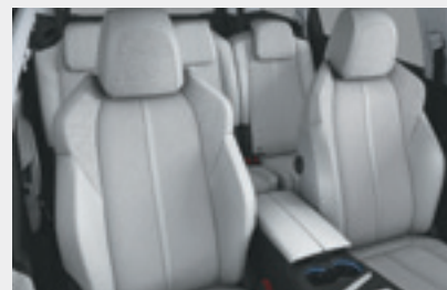
ריפוד פנימי וגימור דלתות בצבע אפור בהיר