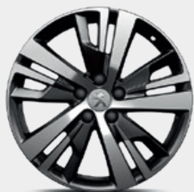
חישוקי סגסוגת 18" DETROIT שני גוונים במארג יהלום סטנדרט לדגמי ACTIVE ו-PREMIUM