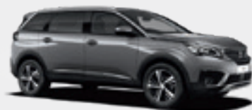
Artense Grey | F4M0 | כסוף כהה מטאלי |