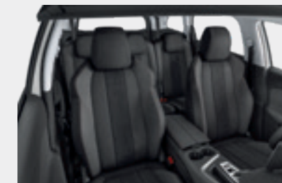
ריפוד פנימי וגימור דלתות בצבע אפור כהה