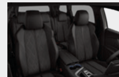
מושבים בריפוד עור מלאכותי משולב אלקנטרה