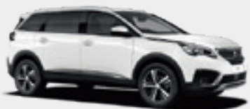
Banquise White | WPP0 | לבן קרחון |