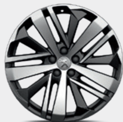
חישוקי סגסוגת 19" WASHINGTON שני גוונים במארג יהלום סטנדרט לדגמי GT