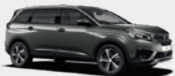
Amazonite Grey | KLM0 | אפור ירקרק מטאלי |