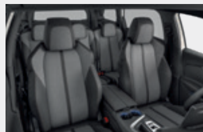
ריפוד פנימי וגימור דלתות בצבע אפור כהה