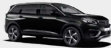
Perla Nera Black | 9VM0 | שחור מטאלי |

לרשותכם עומד מגוון רחב של צבעים שיאפשר לכם להביע את עצמכם באופן מלא. בחרו את הצבע שמתאים לטעם שלכם.