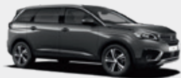
Platinum Grey | VLM0 | אפור כהה מטאלי |