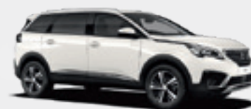
Pearl White | N9M6 | לבן פיניה |