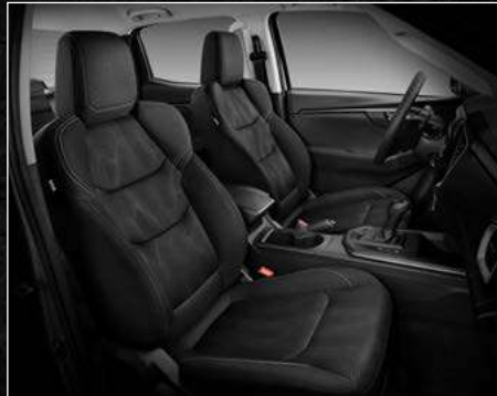
דגם LS+ ריפודי בד בצבע שחור