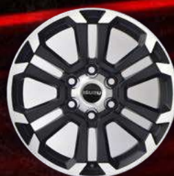
דגם S / S+ *בתוספת תשלום