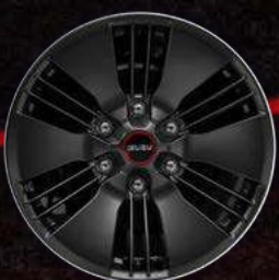
דגם LSE PREMIUM