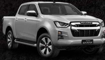
אפור בהיר מטאלי