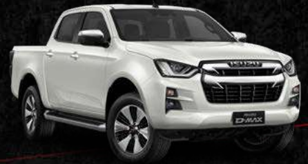
לבן פנינה *בתוספת תשלום