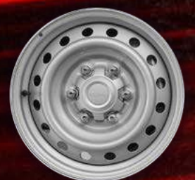
דגם S / S+