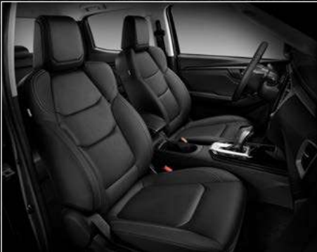
דגמי LS / LSE PREMIUM ריפודי עור בצבע שחור