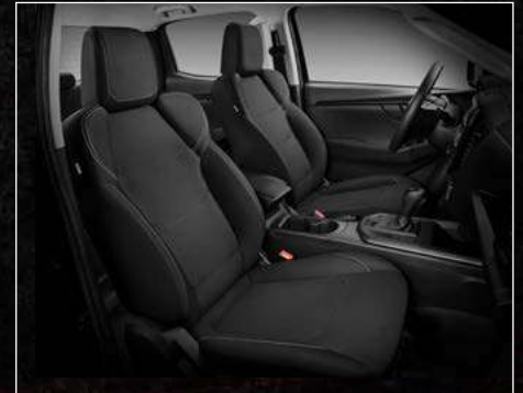
דגם S / S+ ריפודי בד בצבע שחור