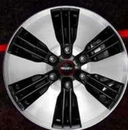
דגם LS PREMIUM