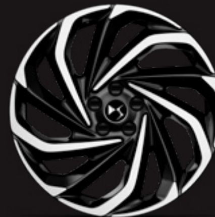
חישוק 19" LONDON