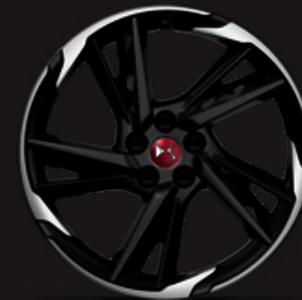
חישוק 19" BEIJING