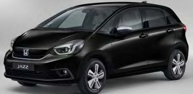
פנינה CRYSTAL BLACK