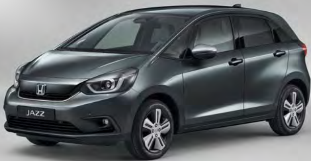
מטאלי SHINING GRAY