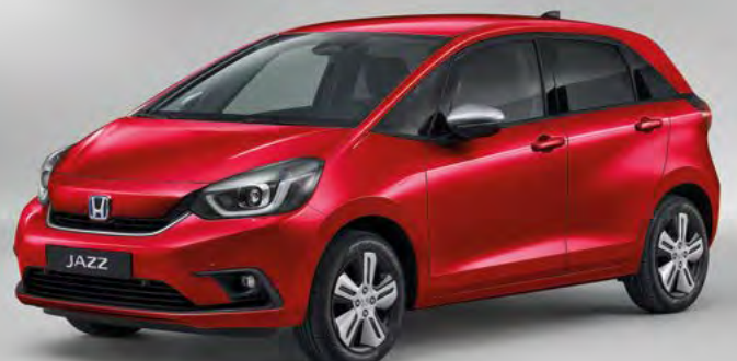
מטאלי PREMIUM CRYSTAL RED