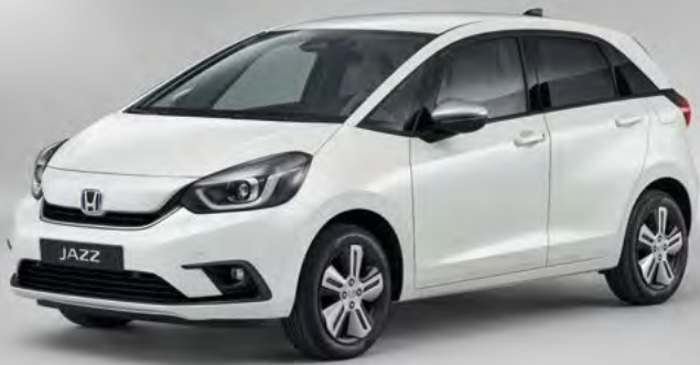
פנינה PLATINUM WHITE