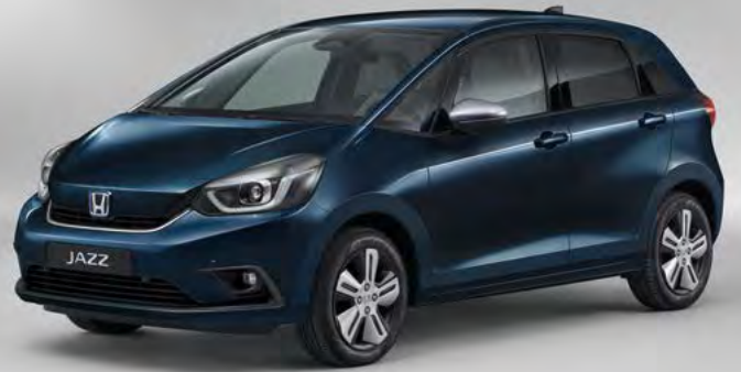
מטאלי MIDNIGHT BLUE BEAM