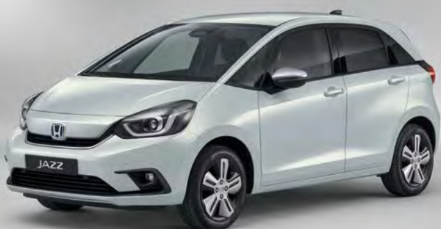
פנינה PREMIUM SUNLIGHT WHITE