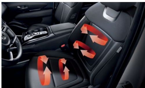
חימום מושבים קדמיים*