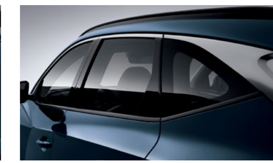
פסי קישוט כרום בחלונות וידיות*