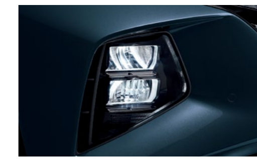
תאורה מלאה מסוג LED*