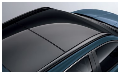
חלון גג פנורמי*