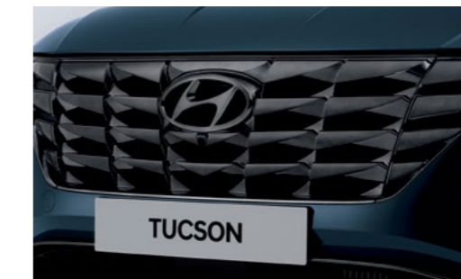
לוגו יונדאי בחזית שבכת הגריל בגימור כרום כהה