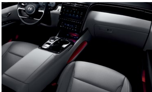
תאורת אווירה ב-64 גוונים