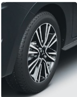
15": חישוקי סגסוגת קלה בדגם PREMIUM