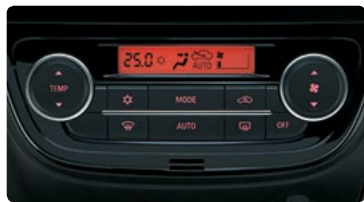
בקרת אקלים דיגיטלית