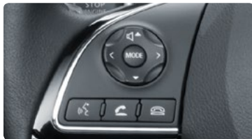
מערכת שמע ודיבורית Bluetooth בשליטה מגלגל ההגה