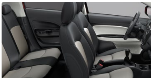
שחור בשילוב כז'