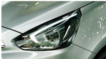
תאורה קדמית מסוג Bi Xenon בשילוב LED*