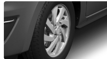
חישוקי סגסוגת קלה 14" **