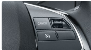
בקרת שיוט CRUISE CONTROL בשליטה מגלגל ההגה