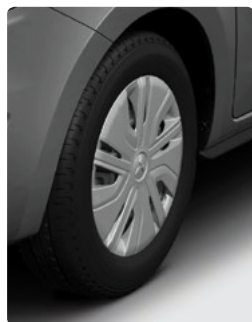
14": חישוקי פלדה בדגם INSTYLE