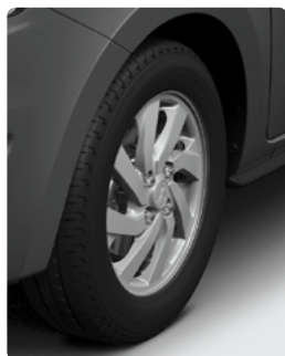
14": חישוקי סגסוגת קלה בדגם SUPREME