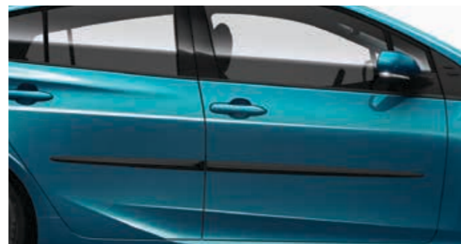
סט פסי הגנה צידיים שחורים לדלתות