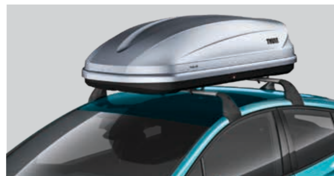
ארגז איחסון גג