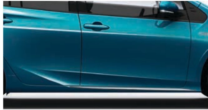
סט פסי קישוט ניקל