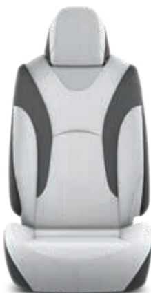
ריפוד מושב בד אפור

זמין בצבעים חיצוניים: לבן פנינה, אפור כהה מטאלי וכחול אקווה מטאלי