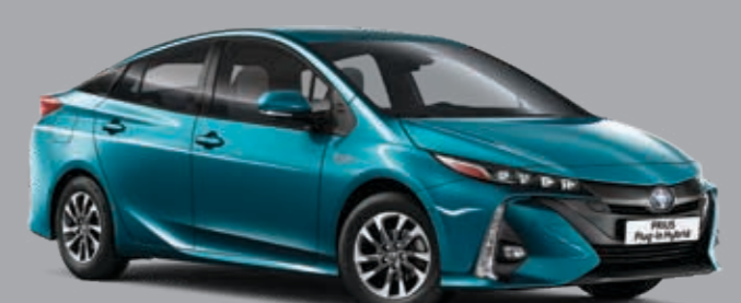
כחול אקווה מטאלי B-791