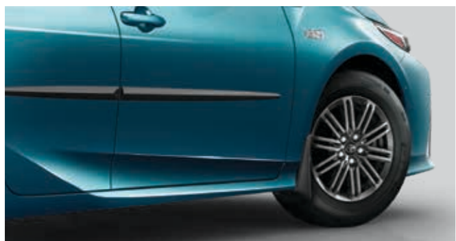
סט מגני בוץ קדמי