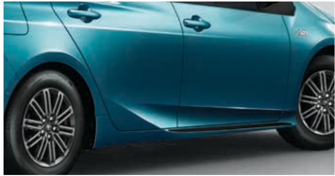
קישוט דלתות שחור תחתון