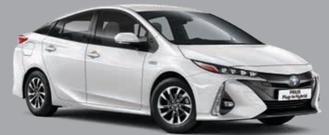
לבן פנינה מטאלי B-070