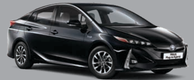
שחור מטאלי B-218