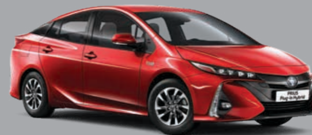
אדום עז B-3U5