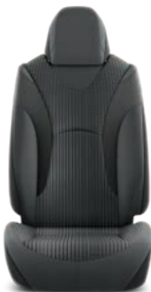
ריפוד מושב בד שחור

זמין בצבעים חיצוניים: לבן פנינה, אפור כהה מטאלי וכחול אקווה מטאלי