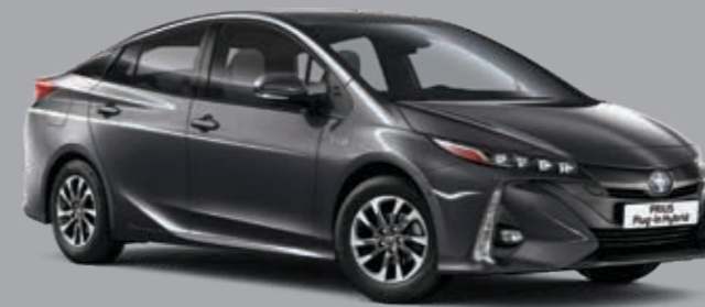
אפור כהה מטאלי B-1G3