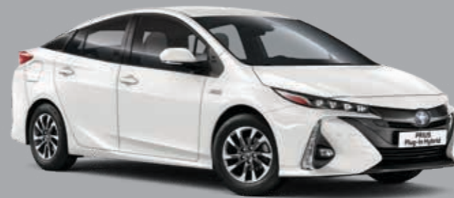
לבן צחור B-040