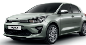
Urban Green [URG]