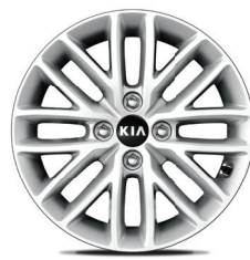
חישוקי סגסוגת קלה 15"