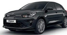
Aurora Black Pearl [ABP]