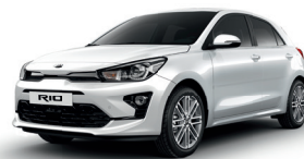
Clear White [UD]