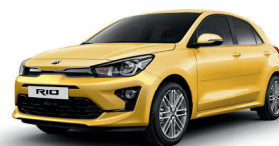
Most Yellow [MYW]