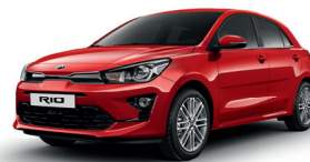
Signal Red [BEG]