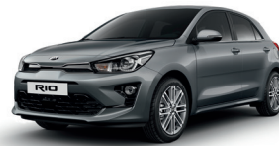
Perennial Grey [PRG]