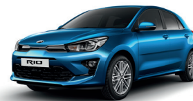
Sporty Blue [SPB]