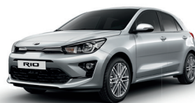
Silky Silver [4SS]