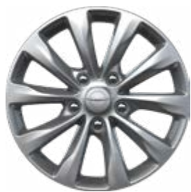
חישוקי 17" ברמת גימור Touring L