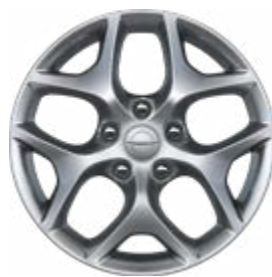
חישוקי 18" ברמת גימור Limited