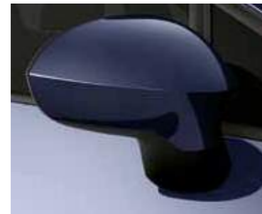
כחול פחם (550)