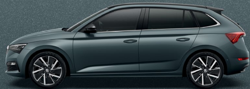
QUARTZ GREY METALLIC