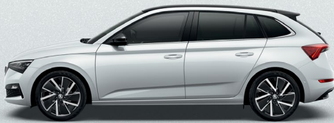
MOON WHITE METALLIC