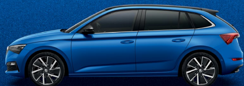
RACE BLUE METALLIC

* ייתכן הבדל בין גוון הצבע הנראה במפרט לבין הגוון בפועל