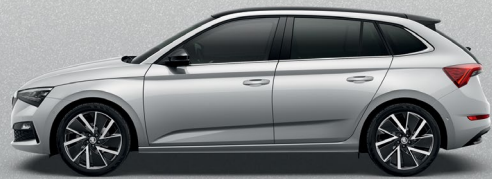
BRILLIANT SILVER METALLIC