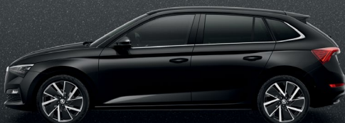
MAGIC BLACK METALLIC