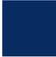
כחול פנינה מטאלי RAY