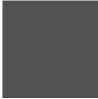
אפור מטאלי KAD